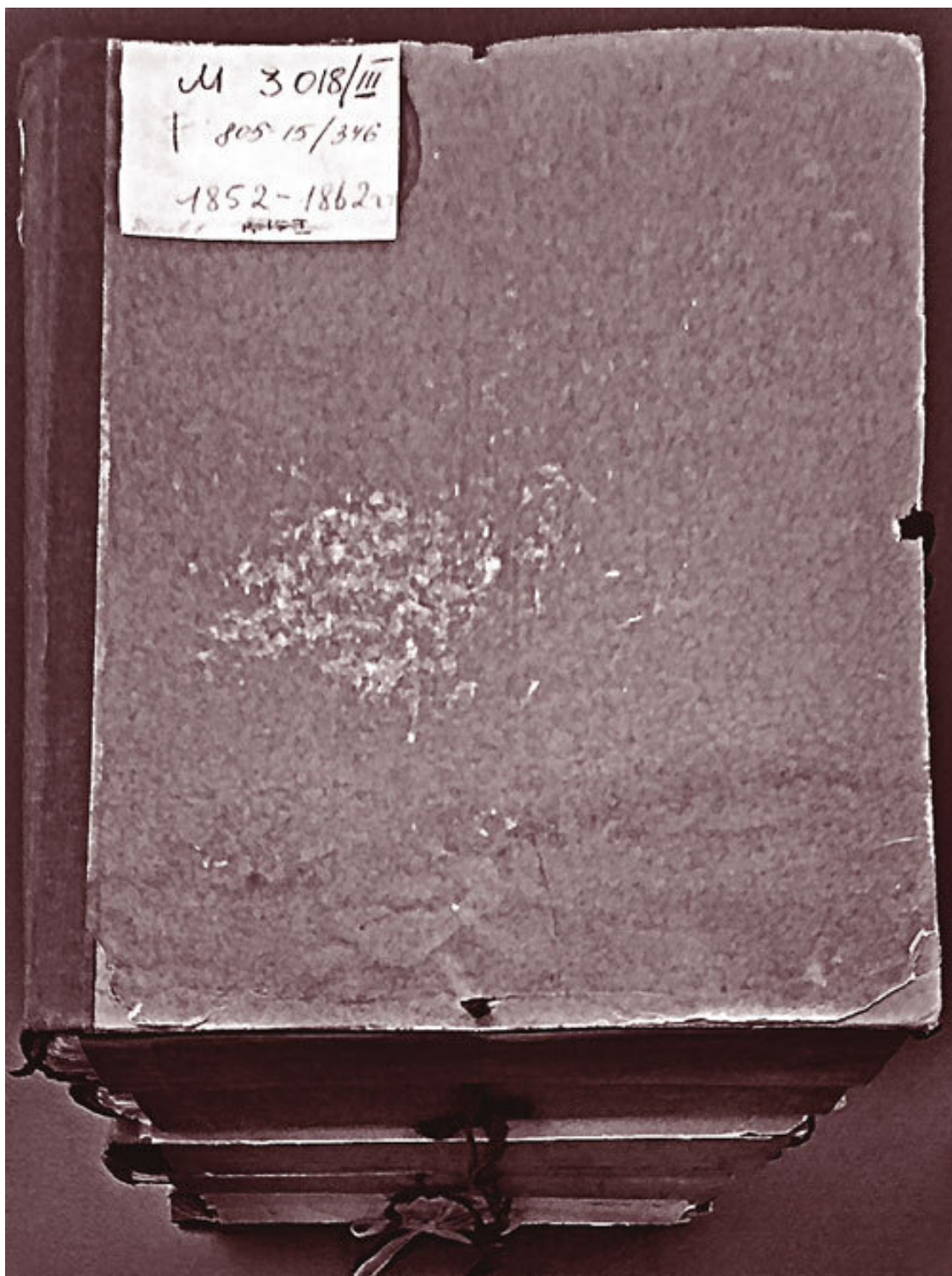
Фотография рукописи, хранящейся в Российской государственной библиотеке. Музейное собрание. Ф. 178.1 (русская и славянская часть). № 3018.1–6

Ф. 446. Оп. 26. Д. 8, 16; Оп. 28. Д. 6, 1: «Материалы всеподданнейших докладов по ведомству путей сообщения» за 1861, 1869, 1883 гг.