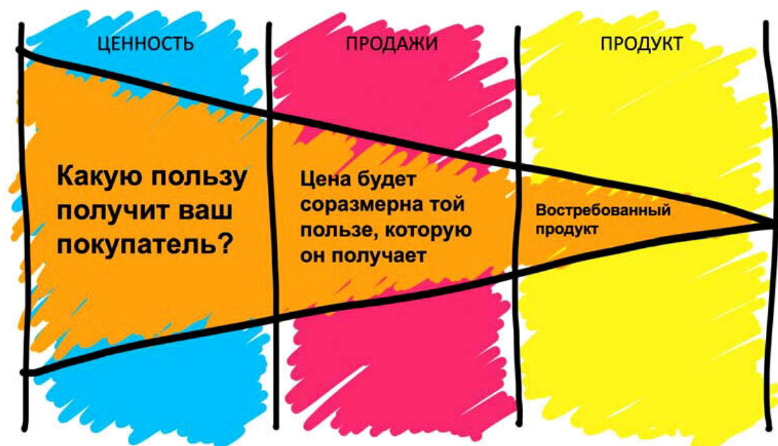
Рис. 2. Ценностное мышление

Производитель, обладающий таким мышлением, задает себе вопрос: «Какую пользу получит покупатель от моего продукта?» И предлагает потребителям решение их проблем в виде своего товара. Как вы думаете, если продукт действительно полезен людям, будет ли важна для успешных продаж его цена (при условии, что она в рынке)?