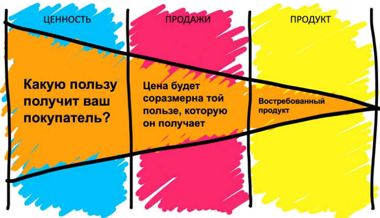
Рис. 2. Ценностное мышление

Производитель, обладающий таким мышлением, задает себе вопрос: «Какую пользу получит покупатель от моего продукта?» И предлагает потребителям решение их проблем в виде своего товара. Как вы думаете, если продукт действительно полезен людям, будет ли важна для успешных продаж его цена (при условии, что она в рынке)?