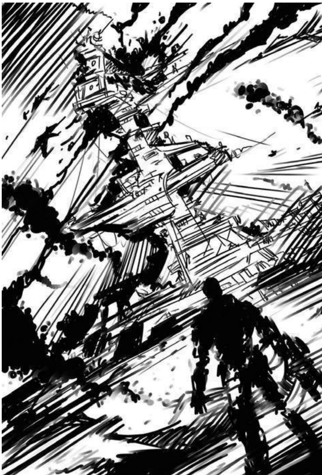
Иллюстрация к рассказу Макса Олина