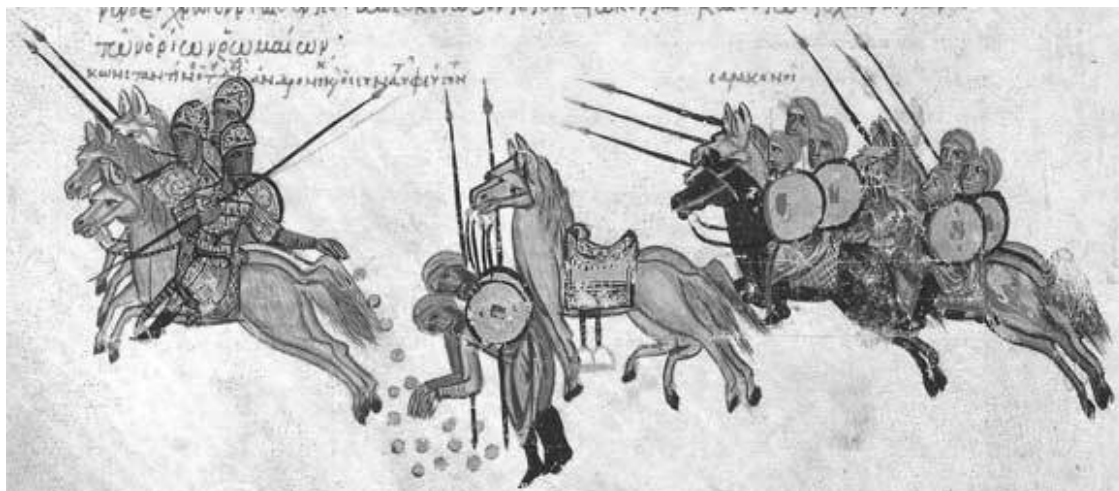
Побег Константина Дуки из арабского плена в 908 году. Миниатюра из рукописи «Мадридского Скилицы» MS Graecus Vitr. 26–2, середина XII века

Если следовать классической точке зрения В. В. Бартольда, необходимо признать, что сельджуки произошли от тюркского племени кынык 17 . В эпоху Западного Тюркского каганата, в VII веке, предки племени кынык будто бы вторглись в Приаральские степи из Семиречья и завоевали пастбища, где кочевали всадники из племени канглы (возможно, родственники печенегов). Эти пастбища еще в античную эпоху принадлежали далеким предкам канглы – сако-массагетским ираноязычным племенам, создавшим Кангюй, Парфянское царство и Кушанскую империю в III–II веках до Р. Х. Как полагали В. В. Бартольд и С. П. Толстов, племена канглы и кынык приняли участие в ассимиляции тех немногочисленных остатков сако-массагетских племен, которые уцелели после столкновений с ранними волнами тюрко-монгольских кочевников, – с гуннами, эфталитами, аварами и древними тюрками Ашина в IV–VI веках 18 , хотя, по мнению Яноша Харматта и Петера Голдена, гунны и тюрки Ашина говорили в основной своей массе на восточно-иранском языке, близком к хотано-сакскому, а не на тюркском 19 .