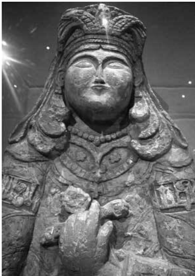
Сельджукский воин. Нью-Йорк. Музей Метрополитен. XI–XII века

С точки зрения современного исследователя А. Пикока, следующего сообщениям арабо-персидской историографии, сельджуки были связаны с огузской военной знатью Хазарского каганата 25 , которая после окончательного упадка каганата на рубеже X–XI веков в поисках новых владений устремилась на юг – в Хорезм и Хорасан. Данная точка зрения не противоречит теории монгольского происхождения сельджукской военной знати, так как монгольские предки Тогрул Бека могли вступать в договорные отношения с хазарскими каганами, брать в жены тюркских княжон, а основную массу сельджукских вооруженных сил, в любом случае, составляли тюркские племена огузов. Завоевание сельджуками Анатолии после 1071 года создало предпосылки для ассимиляции тюрками греческого населения этого региона, а новые потоки туркменских племен, мигрировавших по маршрутам, которые были проложены сельджуками в XI веке, в итоге привели к появлению в конце XIII века османского государства. Вместе с тем, гипотеза о монгольском происхождении династии Сельджукидов в определенной степени может быть подкреплена фактами из истории соседней империи Ляо, созданной в X веке воинственными киданями в монгольских степях и в северном Китае. Возвышение рода Сельджука среди многочисленных тюркских ханов может быть объяснено лишь исклю-