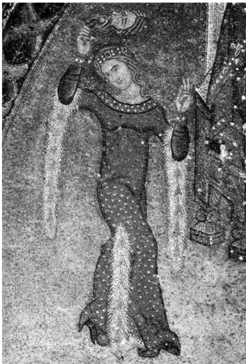
Византийская знатная дама в образе Саломеи с головой Иоанна Крестителя. Мозаика из баптистерия собора Сан-Марко, Венеция, XIII–XIV века