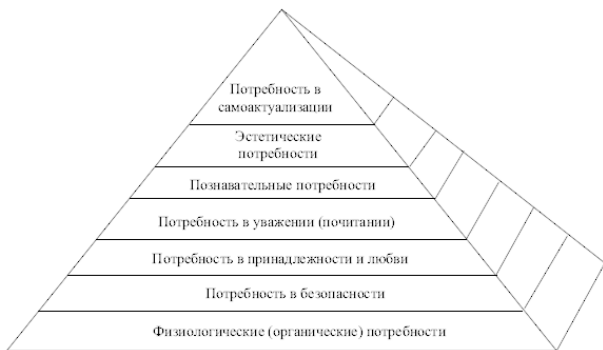
Рис. 1. Иерархия потребностей (пирамида А. Маслоу)

Очевидно, что потребности более высокого порядка (в безопасности, уважении, самоактуализации) могут быть реализованы только при условии удовлетворения потребностей, положенных в основание пирамиды. Следовательно, проблема улучшения жилищных условий, расширения спектра и повышения качества жилищно-коммунальных услуг по-прежнему остается актуальной в контексте решения задач повышения уровня и качества жизни, благосостояния россиян.