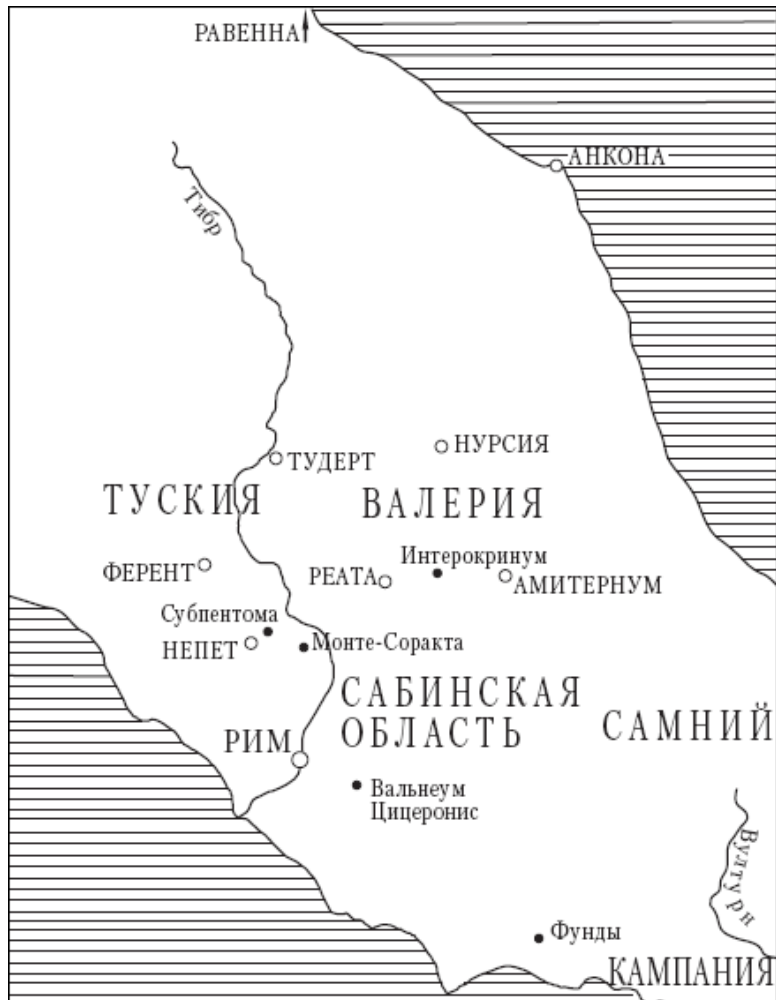
Карта Средней Италии