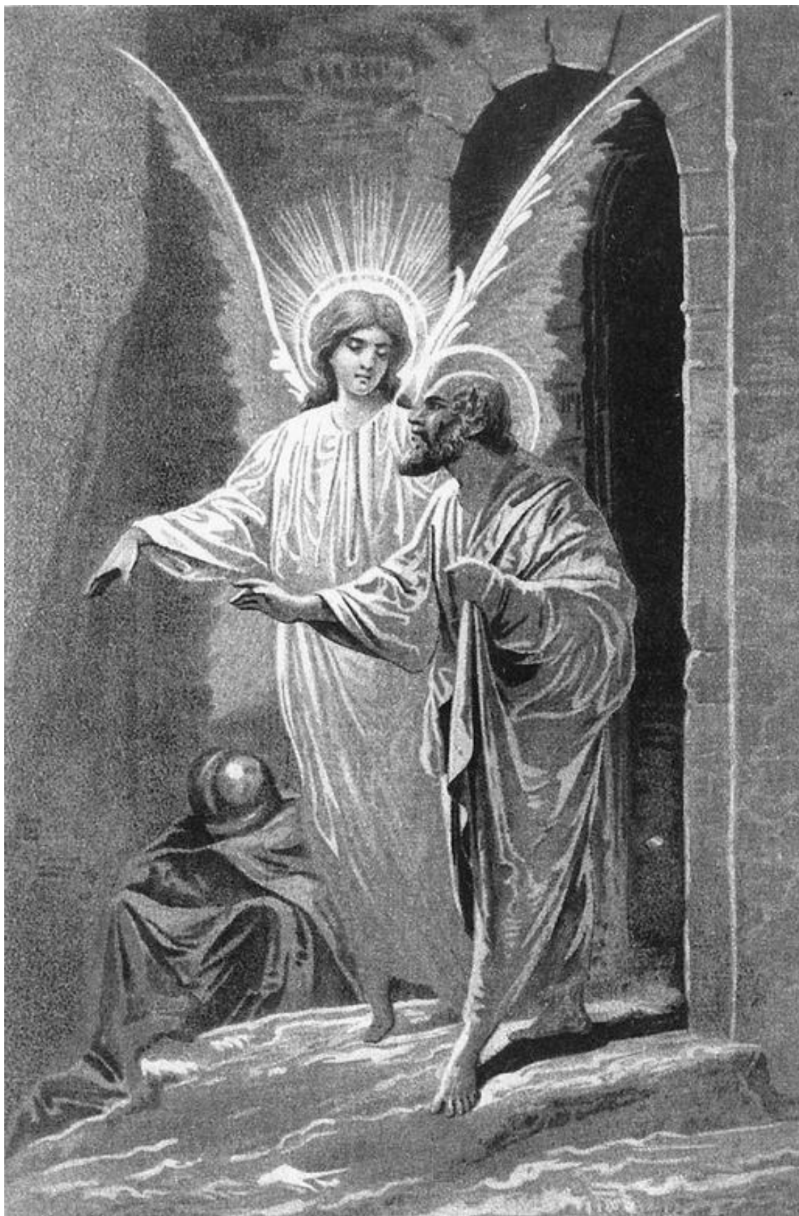
Ангел выводит апостола Петра из темницы