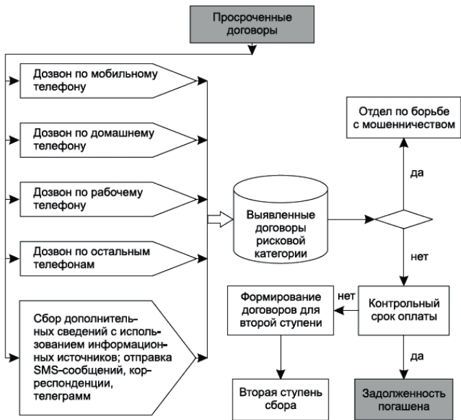
Рис 1.2. Схема работы первой ступени сбора