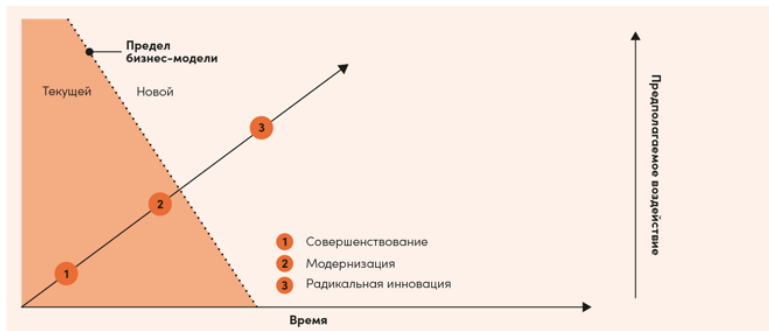
Рисунок 4. Реализация трех типов стратегий: совершенствование, модернизация, радикальная инновация