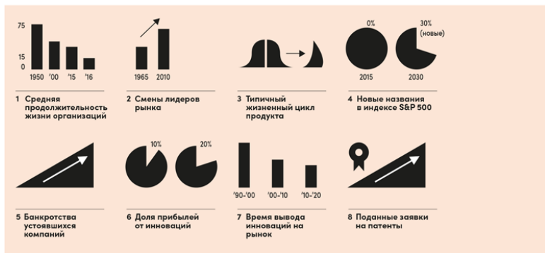
Рисунок 1. Новая нормальность никуда не ушла. Ее влияние налицо. Инновации — игра особо трудная, но в ней скрыто много возможностей для тех, кто знает, как их обнаружить

Факты, показывающие, чем так отличается новая нормальность от «старой», суммированы на рис. 1. Тенденция очевидна: непрерывность перестала быть данностью, и главной причиной этому является, конечно, цифровизация.