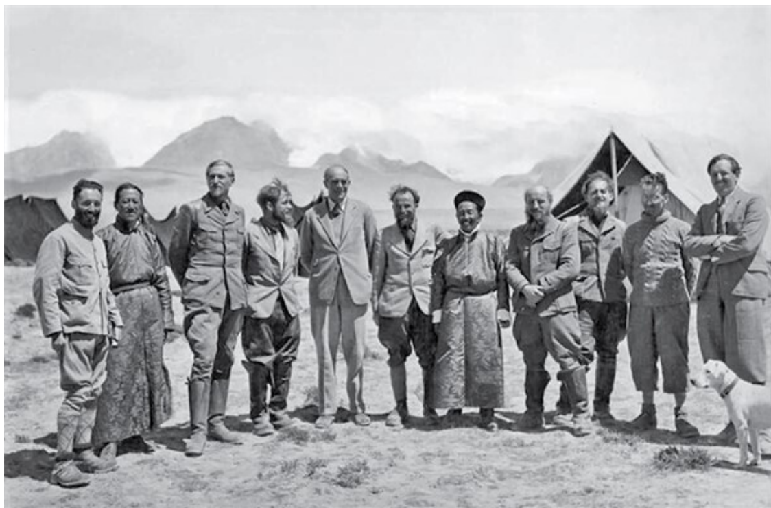
Фотографии из экспедиции Эрнста Шеффера в 1938 году в Лхасу