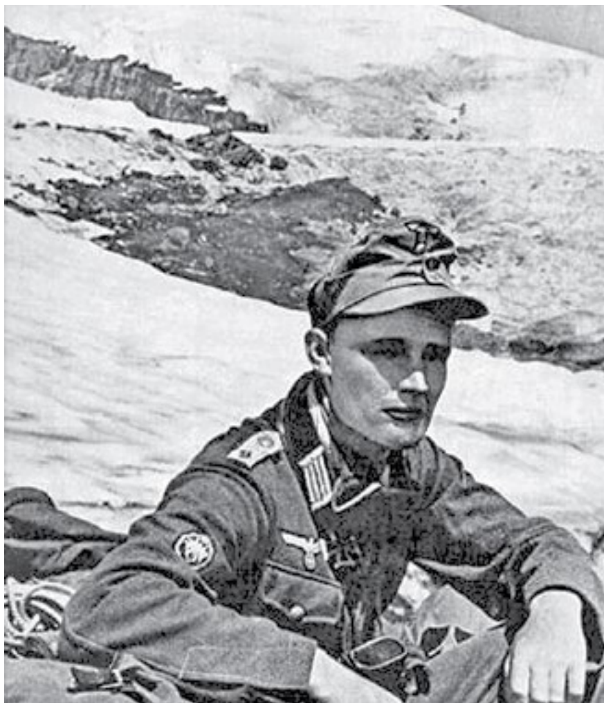
Гитлеровцы в Приэльбрусье. 1942

Принимало ли летное поле под Эльбрусом самолеты – вопрос спорный. По своим параметрам оно соответствовало аэродрому, годному для приземления даже тяжелых бомбардировщиков, может и сейчас принять даже самые современные самолеты – об этом нам говорили специалисты. Но вот по сводкам наших военных летчиков место это не проходит. Олег Опрышко, автор книги «На Эльбрусском направлении» (Нальчик, 1970), досконально изучивший военные архивы, тоже категоричен: аэродрома здесь не было. Но вот что интересно: тем не менее он о нем слышал, причем неоднократно. И даже, пытаясь выяснить истину, расспрашивал об этом Александра Сидоренко, того самого, знаменитого, снимавшего с группой альпинистов фашистский флаг с Эльбруса. Подтверждения, что и понятно, не получил. Но ведь аэродром-то считался тайным, и в те времена сплошной секретности о нем могли знать лишь единицы.