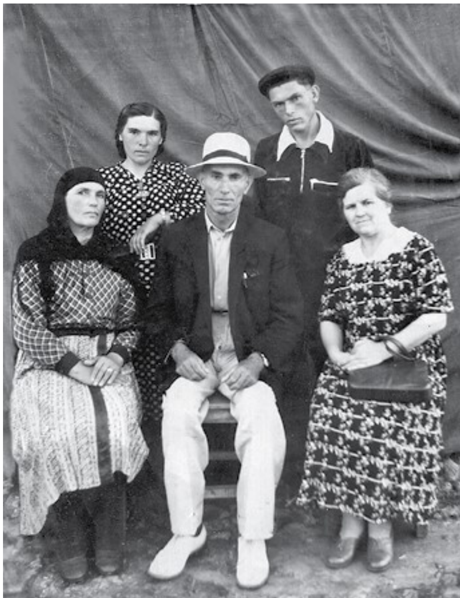
С супругой и родственниками