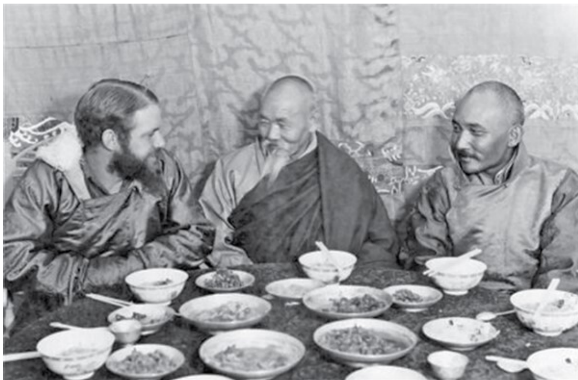
Фотографии из архива экспедиции Эрнста Шеффера в 1938 году в Лхасу