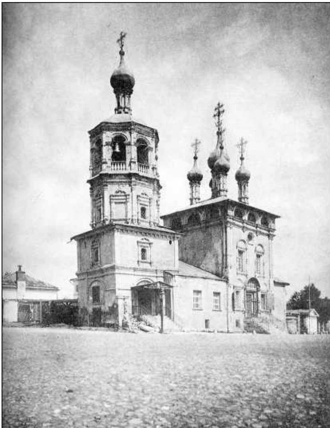
Храм Похвалы Пресвятой Богородицы, что в Баимачках, 1880-е гг.