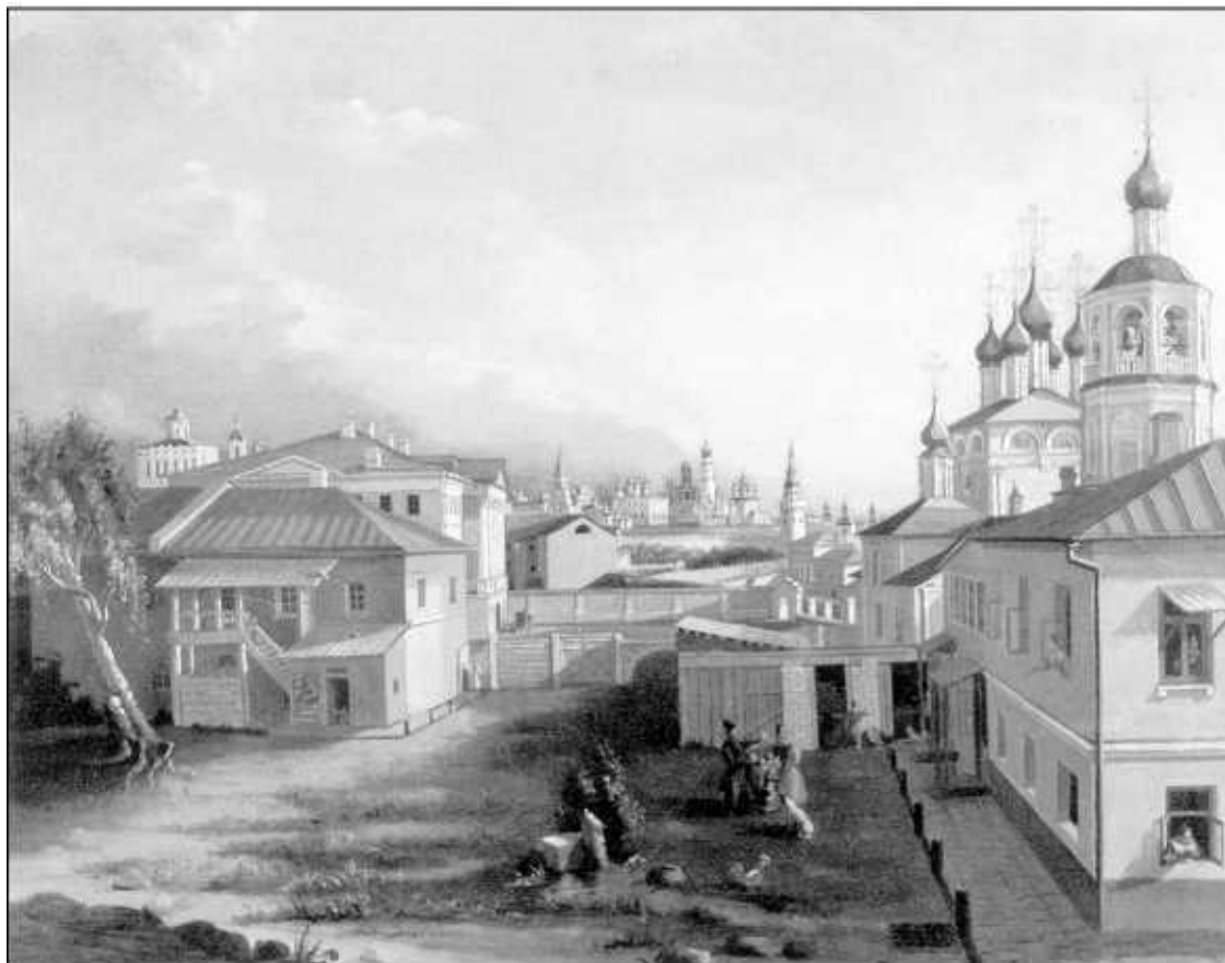
Неизв. художник. Московский дворик близ Волхонки, 1830-е гг.

Кабак – это был клуб простого народа, где велась беседа по целым дням и ночам. Оттого и пословицы: «Людей повидать, в кабаках побывать», «Где хотите, там и бранитесь, а на кабаке помиритесь», «Где кабачок, там и мой дружок». При некоторых кабаках были игры «не на деньги, но для приохочивания покупателей на напитки и для приумножения казенного дохода и народного удовольствия». Прежде над кабаками были гербы, а по праздникам знамена, флаги, выпела, но потом все это воспретили и дозволили только простые надписи. Одно время ставили елку, и так как эти заведения приносили большой доход, то и сложилась пословица: «Елка зелена, денежку дает». «В 1626 г. в Москве было только 25 кабаков, в 1775 г. на 200 тысяч жителей – 151, в 1805 г. – 116, а в 1866 г., когда сивуха получила название дешевки – 1248 кабаков. Теперь, по крайней мере в столицах, мы избавлены от этих милых заведений» 3 .