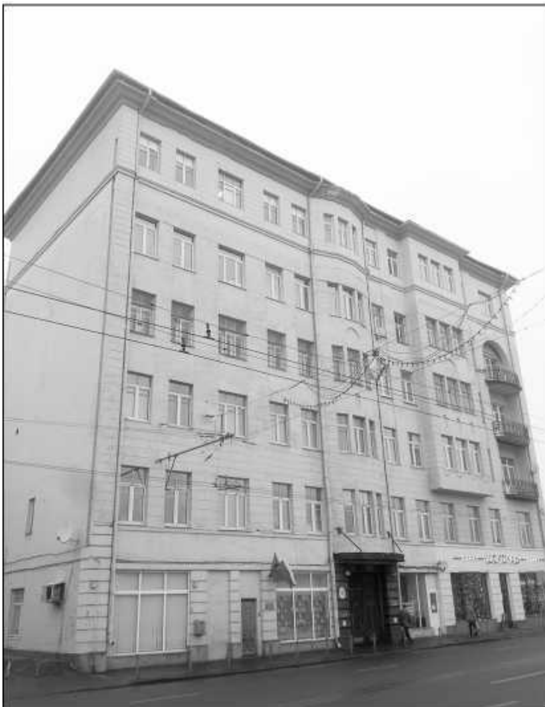
Волхонка, дом 6