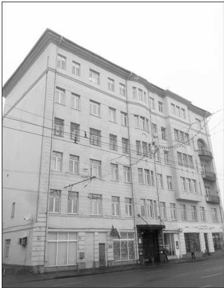
Волхонка, дом 6