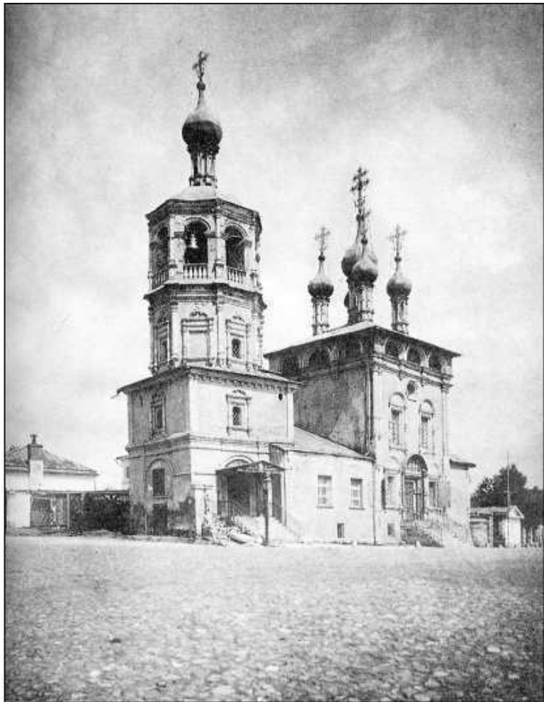
Храм Похвалы Пресвятой Богородицы, что в Башмачках,