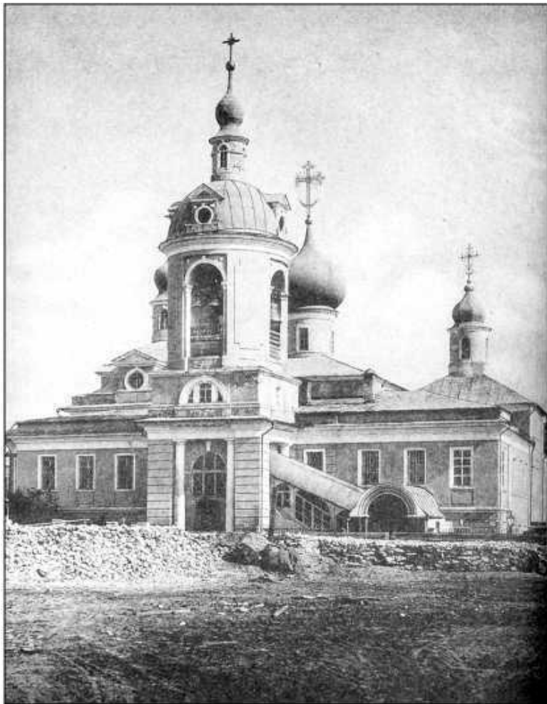
Храм Святого Антония, 1880-е гг.