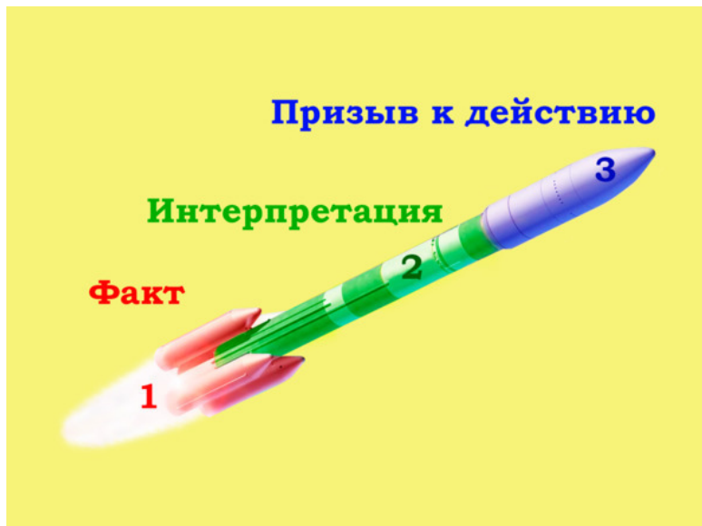
Рисунок 1. Схема убеждения «Ракетой».

Наглядно схема выглядит следующим образом: