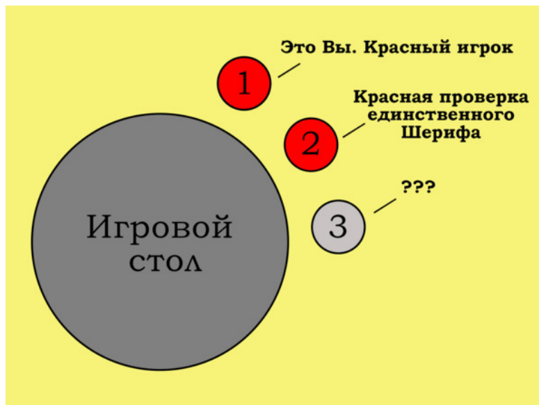
Рисунок 3. Угадайка. Иллюстрация к простейшей задаче на счёт игры.

за столом есть живая красная проверка (#2) единственного Шерифа. Кто мафия?