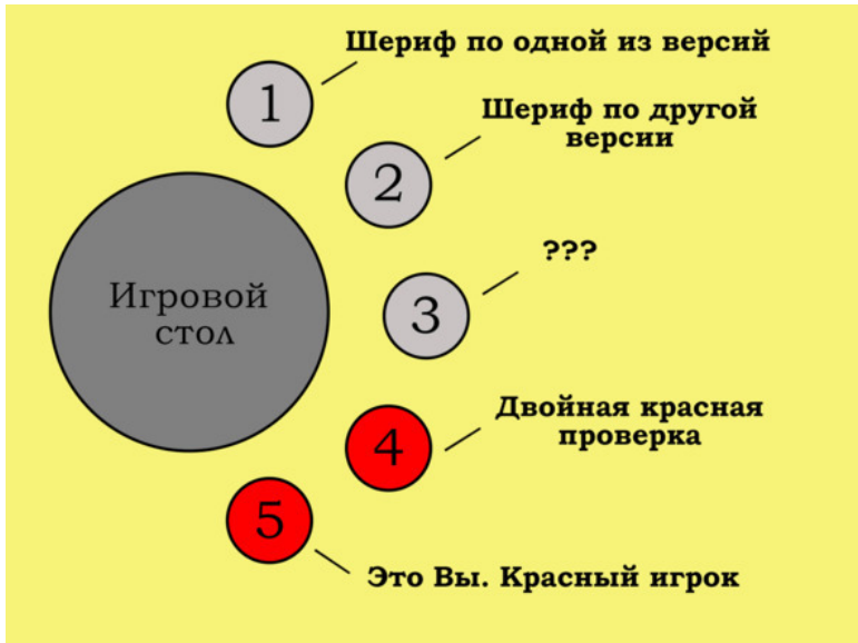
Рисунок 4. Критика на 5-х. Иллюстрация к задаче на счёт игры.

Снова применяем метод вычитания! Используйте для рассуждений бумажку и ручку, если задача не даётся мгновенно. Попробуйте решить сами и только потом переходите к ответу.