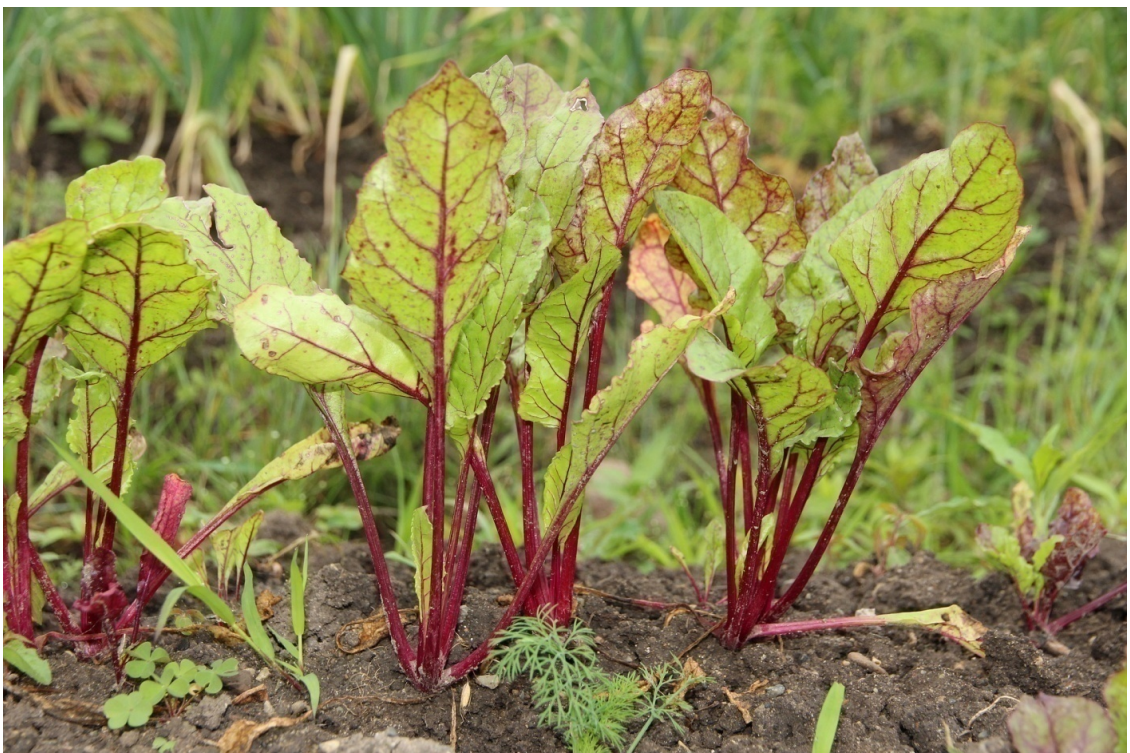
Рисунок 5 Ботва свеклы поверх грядки.