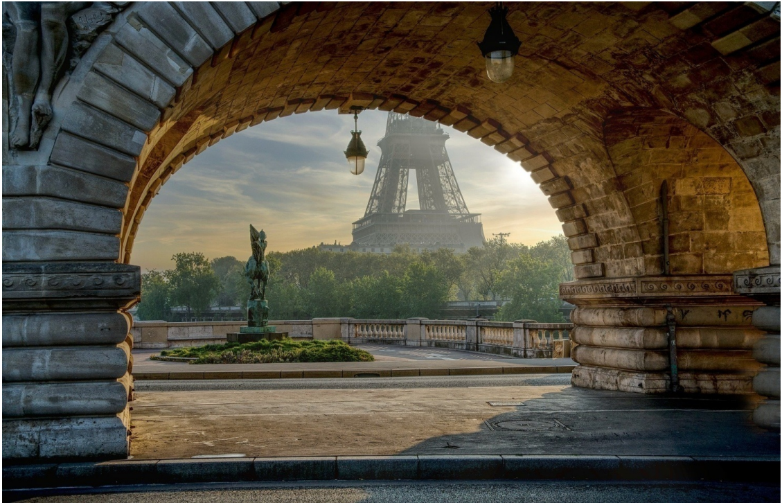
Рисунок 2 Арка