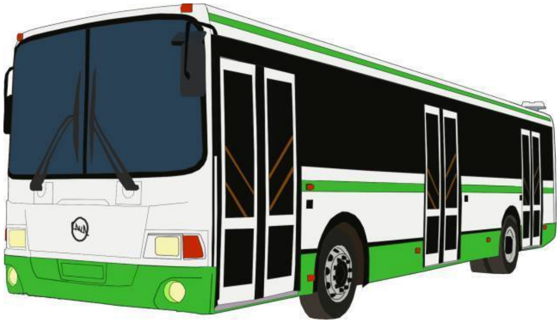
Рисунок 1 Пассажирский автобус

А вот фруктовый магазин! Здесь припасли для нас Антоновку и апельсин, Арбуз и ананас. Вот абрикос, а вот айва Какие вкусные слова- И все на букву А. (С. Маршак)