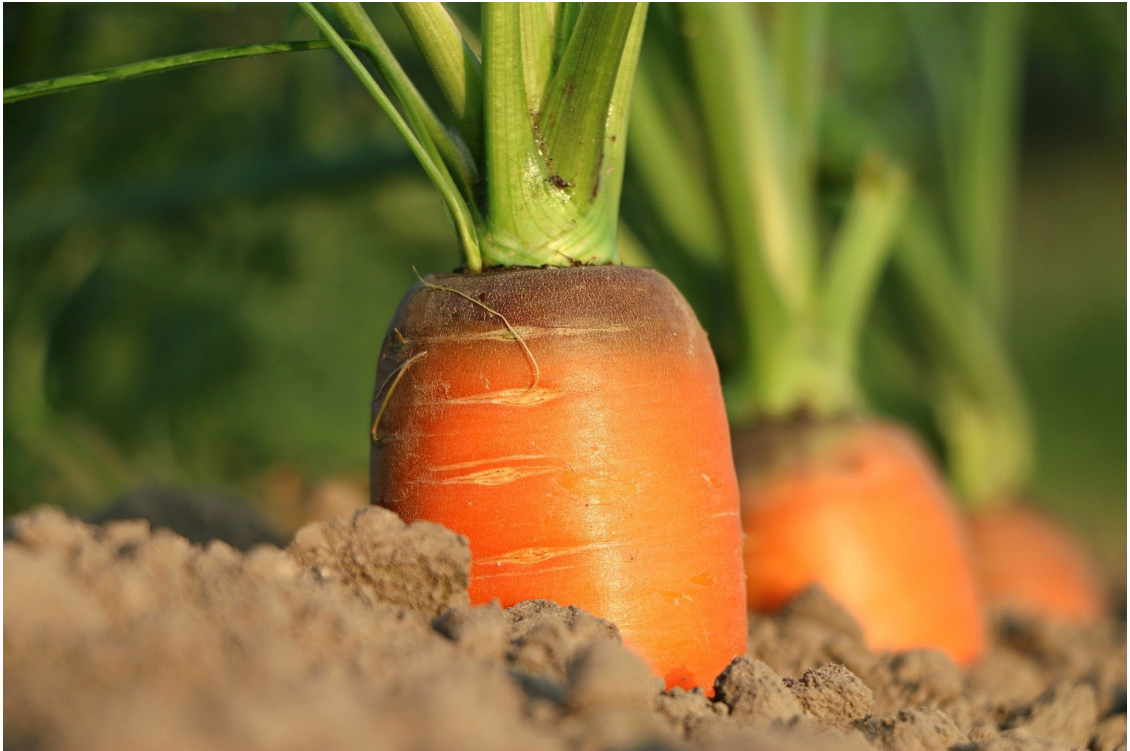
Рисунок 4 Морковь в земле