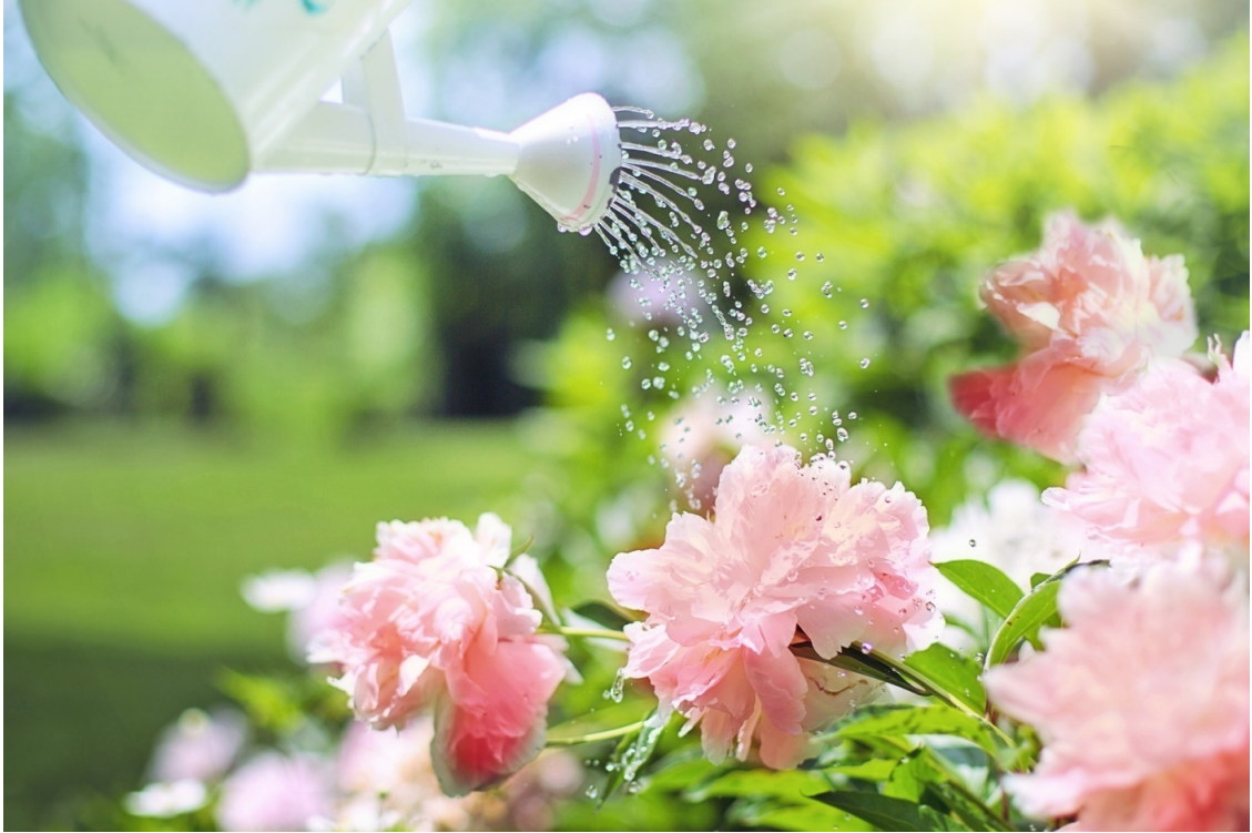
Рисунок 6 Полив пионов

Дети посадили в саду тюль-па-ны и маки. Мама сказала: "По-лей-те цветы, чтобы они выросли кра-си-вы-е и боль-шие".