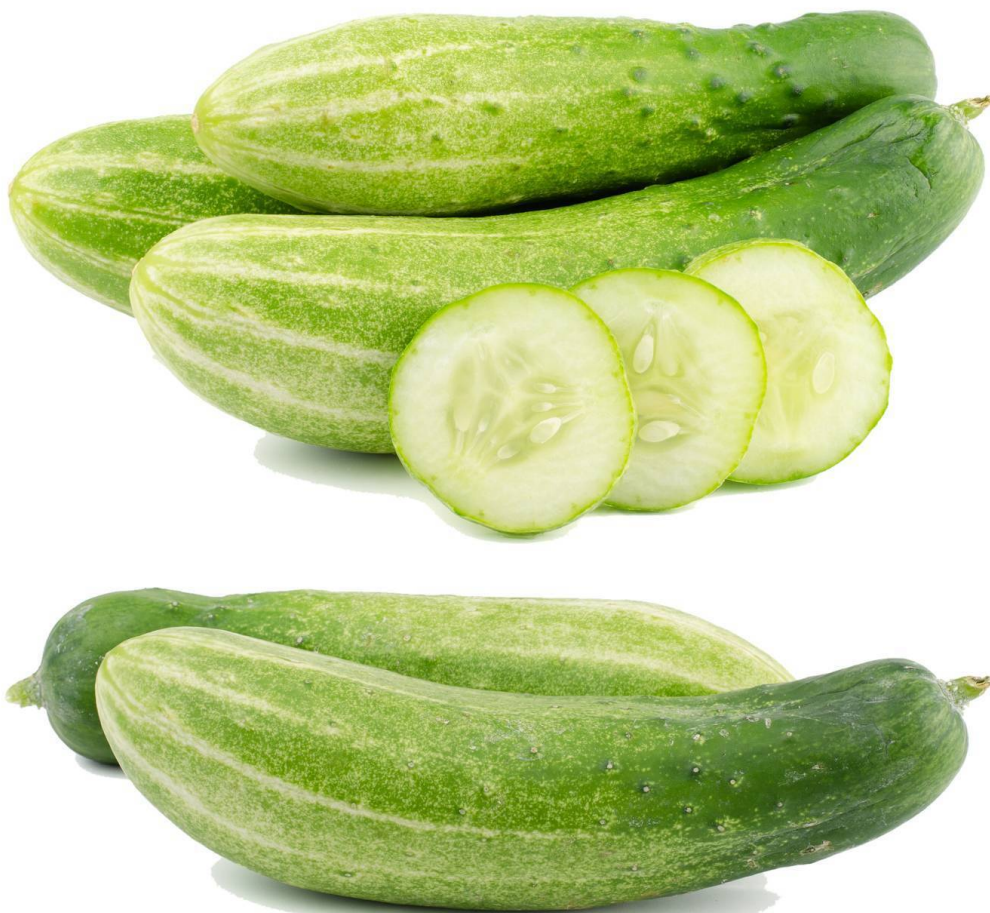
Рисунок 3 Огурцы