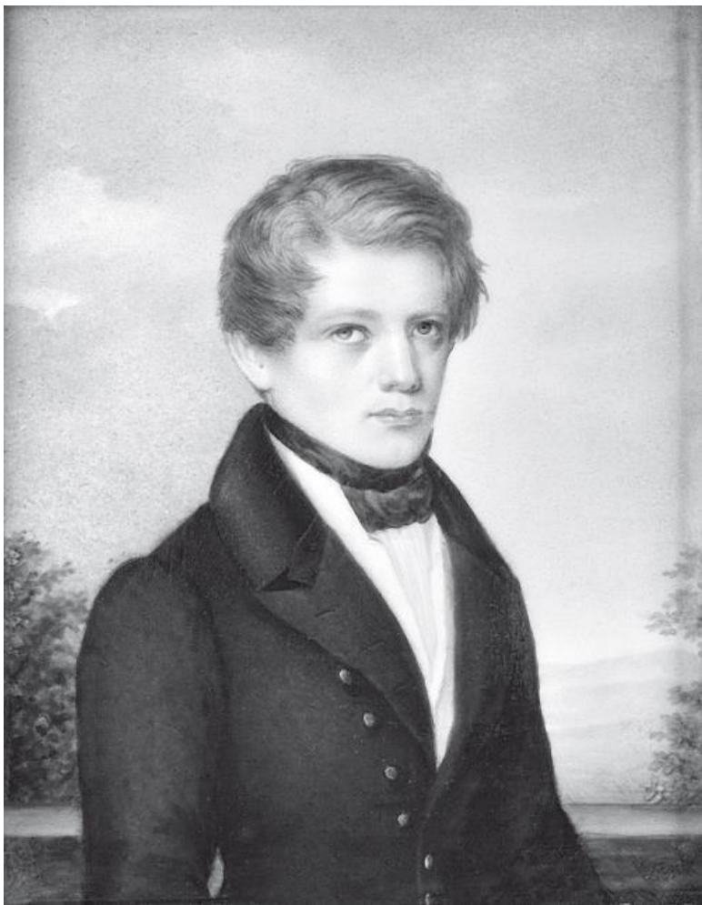
Отто фон Бисмарк – студент, 1833 г.