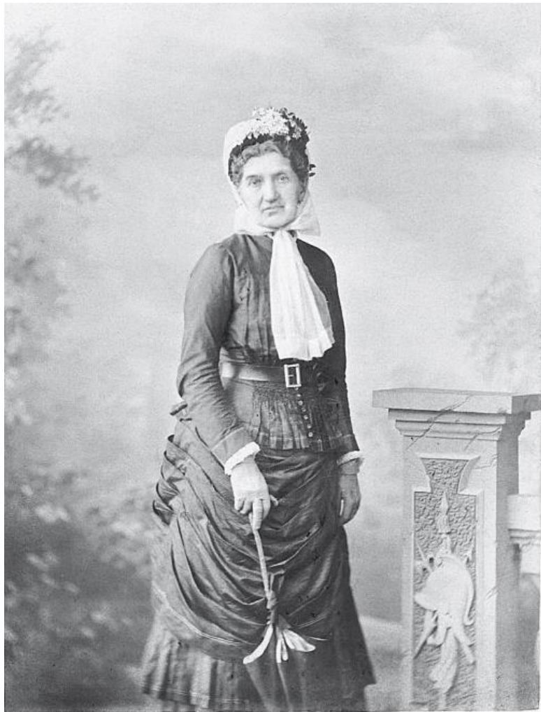
Супруга Отто фон Бисмарка – Иоганна Фридерика Шар-