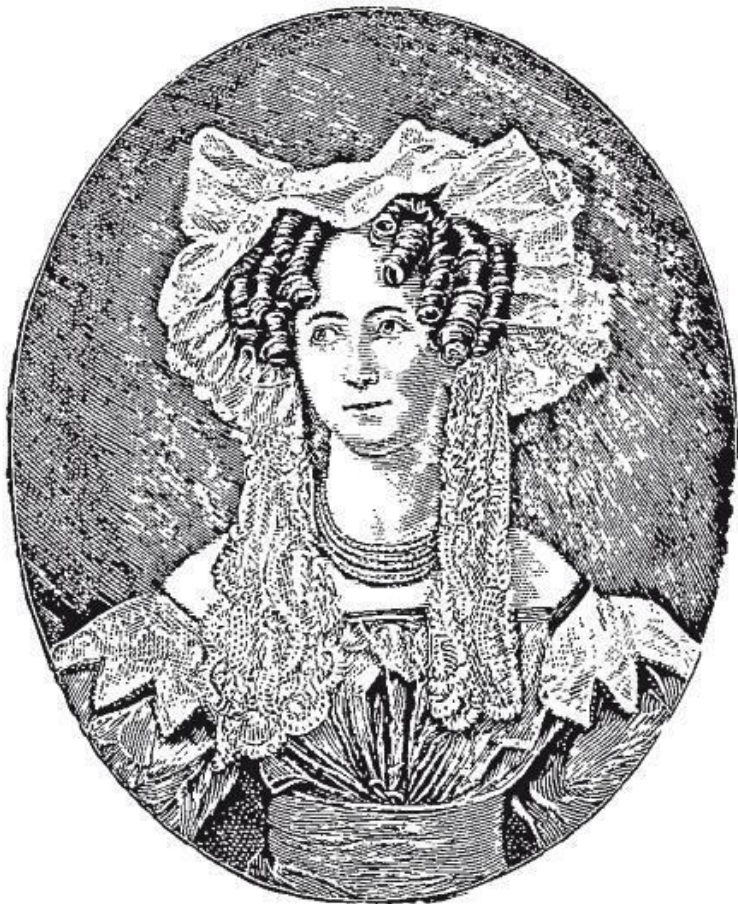
Вильгельмина Луиза Менкен – мать Отто фон Бисмарка