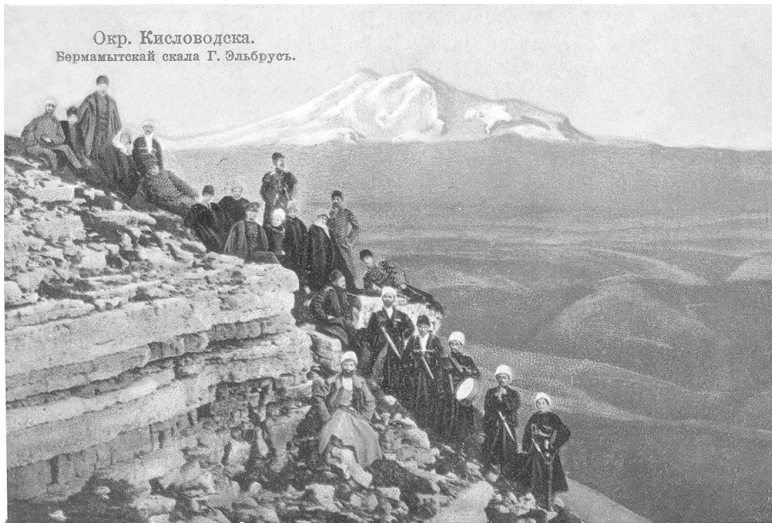
Окр. Кисловодска. Бермамытской скала Г. Эльбрусъ.