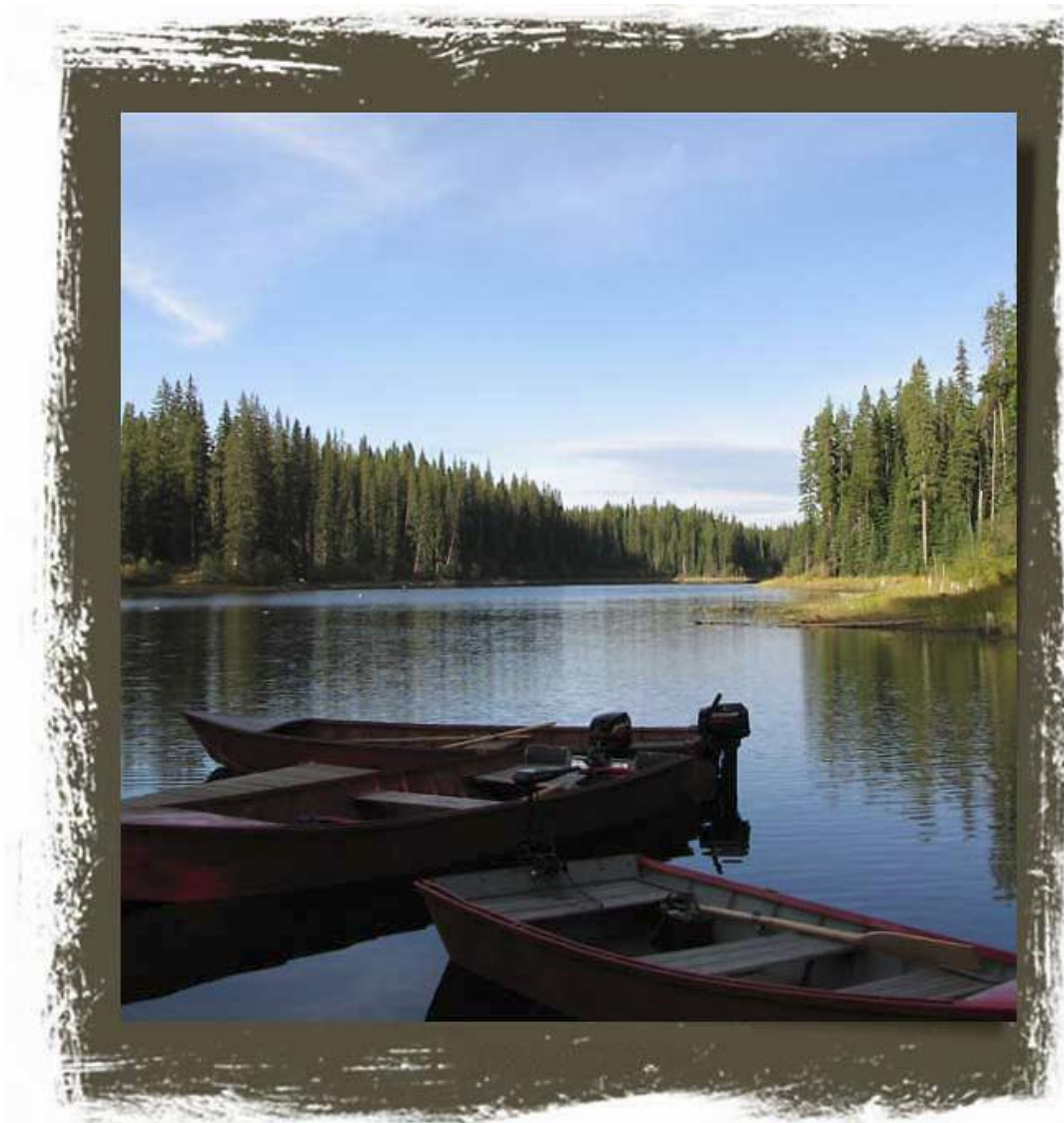
Лодки на реке