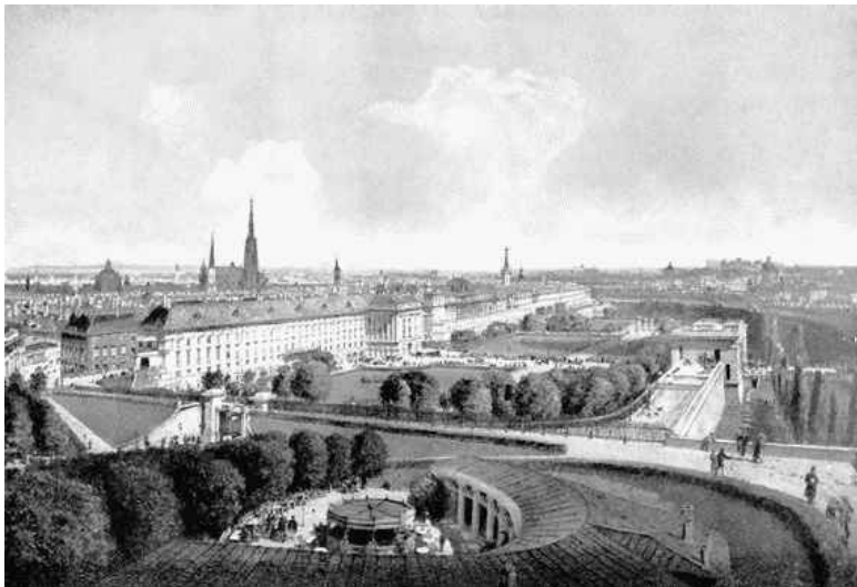
Венские крепостные валы, превращенные в прогулочную зону. Фотография 1830 года

Будучи одним из самых мощных водных путей Европы, Дунай не имел большого значения для развития австрийской столицы. Могучая река протекала в стороне, а к городу подходили ручей Вин и речной рукав, именуемый Дунайским каналом. Ограниченный двумя водными потоками и собственной крепостью, Вена разрасталась кольцеобразно. С востока к городским стенам подступали поля с редкими деревьями. Земли, расположенные между каналом и Дунаем, образовывали своеобразный остров, застроенный рыбацкими хижинами и домами торговцев-евреев, которым долго пред-