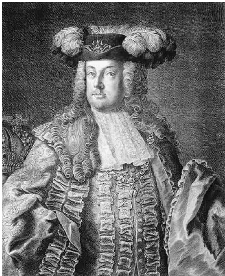
Император Франц I