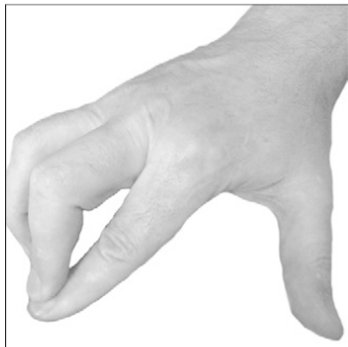
Фото 1. Положение большого пальца при надавливании: совмещенные пальцы (г, д) ( окончание )

Ладони (или только опорная часть ладони ) тоже нужны для больших участков, а также для давления на глаза. Ладони не поранят глаза, как это могут сделать пальцы при случайном соскальзывающем движении.