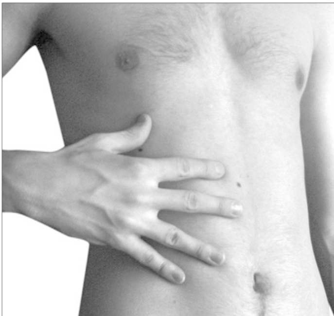
Фото 2 (окончание). Граблеобразное растирание

Разминание тоже соответствует своему названию. Ткани «мят» с переменным усилием, от нулевой чувствительности до порога болевых ощущений. Направление разминания в нашем случае – центростремительное. Когда массаж производится двумя руками, ткани тела захватываются глубоко, одна рука смещает их от себя, другая к себе. Или же движения рук перетекают из одного в другое, создавая непрерыв-