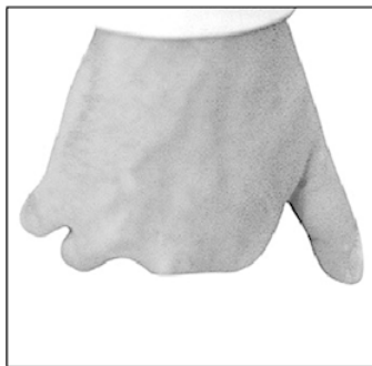
Фото 1. Положение большого пальца при надавливании: правильное (а), неправильное (б, в)

Если вы думаете, что неправильное положение навредит массируемой коже или мышцам, то ошибаетесь. При достаточно сильном надавливании