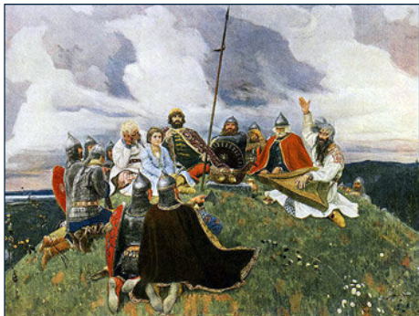
В. М. Васнецов. Баян. 1910 г.

В действительности «Рафли были оригинальной русской гадательной книжкой, благодаря которой гадали с помощью трех игральными костей, а прилагаемая таблица помогала определить какой был сделан бросок – удачный или неудачный и что он предрекал человеку.