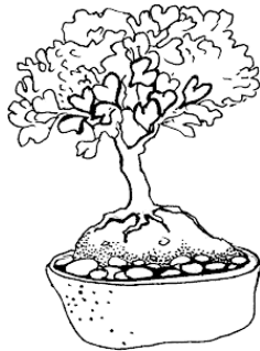
Рис. Композиция с бансай.

Культура бансай предусматривает некоторые первоочередные решения, специальную агротехнику и методы, которые необходимо рассмотреть перед тем, как переходить к основному и подробному описанию. Некоторые бансай произрастают и развиваются из семян, другие начинаются с черенков и отводки. В первую очередь, следует выбрать определенный вид растения. Начинать надо с тех видов растений, которые произрастают в данной местности. В регионах с прохладным климатом это могут быть хвойные растения, цветущие и плодоносящие виды.