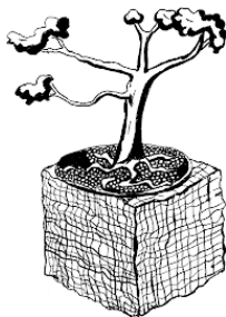
Рис. Композиция в стиле бансай.

Традиционные бансаи являются предметом гордости в семье и передаются по наследству.