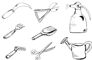
Рис. Инвентарь для ухода за комнатными растениями.

Приобретение этого нехитрого инвентаря не представляет никаких трудностей. А для хранения всех этих принадлежностей лучше выделить ящичек на кухне или на балконе.