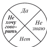
Рис. 6. Работа со словами «Не хочу говорить»

Возможно, это будет качание по противоположной диагонали или другое движение. Следите за маятником, Подсознание «подумает» и покажет. Это движение также надо запомнить раз и навсегда.