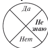
Рис. 5. Работа со словами «Не знаю»

– Какое движение означает для меня «Не знаю»? Маятник покажет что-то. Возможно, это будет качание по диагонали, но может выбрать для вас лично и что-то другое. Запомните его тотчас же, можете даже зарисовать, потому что впредь уже нельзя будет менять.