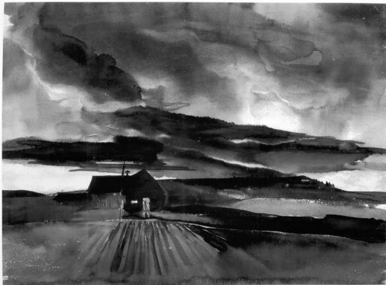
«Конец дня», Мэри Блэр, 1938 г.

На таких молчаливых собраниях рождались самые красивые раскадровки, которые когда-либо видела студия. Наброски не создавались наспех за пару месяцев, это были идеи, которые отвергались годами, так, например, Сильвия адаптировала самые первые наброски Бьянки танцующих цветов и фей. Этель и Бьянка часами сидели где-нибудь на территории студии, зарисовывая, как сорняки прорастают через асфальт, стараясь передать на бумаге, как они колыхнутся от каждого дуновения ветра.