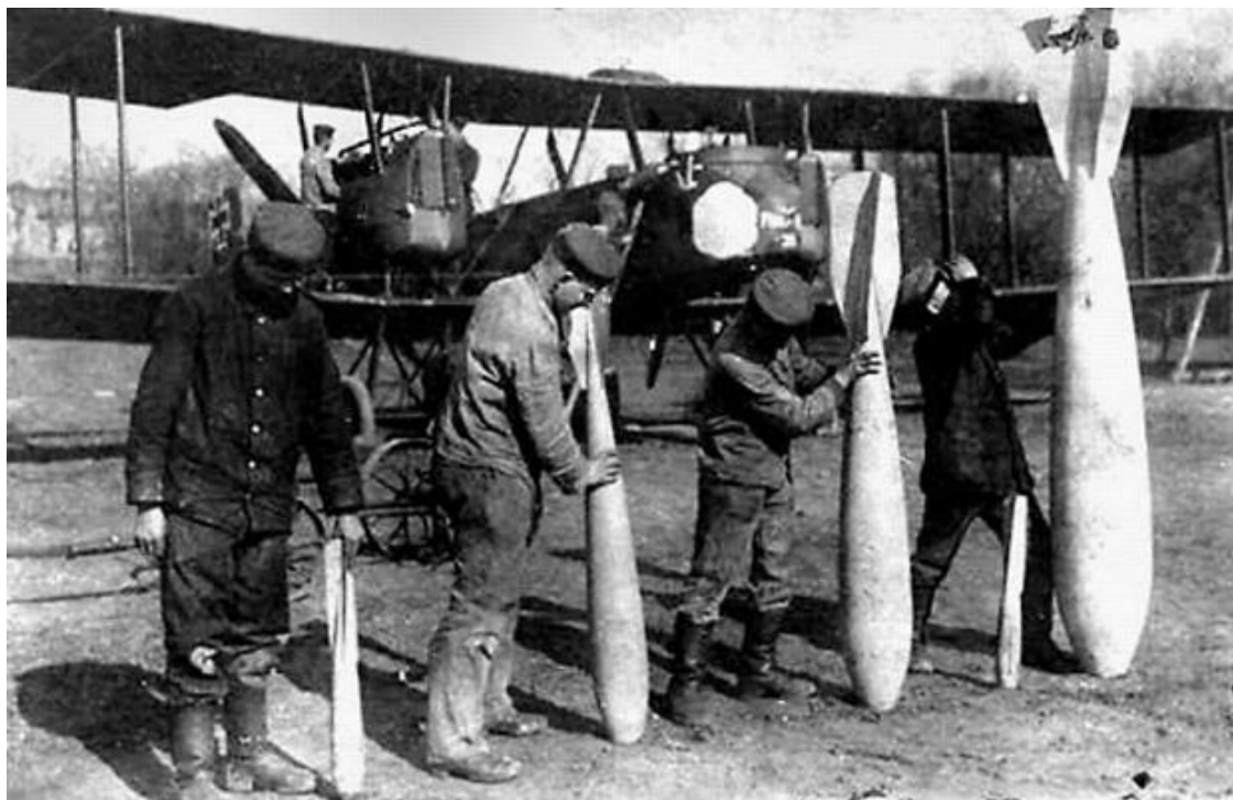
Немецкое военное снаряжение