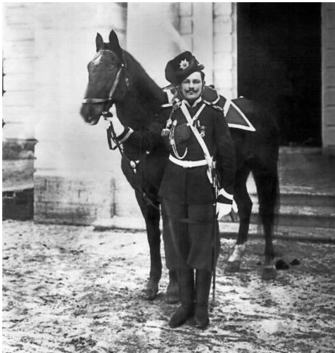
Урядник Сибирской полусотни 3-й сотни лейб-гвардии Свободно-Казачьего полка. 1914 г.

На следующий день штаб казачьей дивизии и мы с ним отошли версты за четыре, так что нам были видны только фабричные трубы местечка Р. Меня послали с донесением в штаб нашей дивизии. Дорога лежала через Р., но к ней уже подходили германцы. Я все-таки сунулся, вдруг удастся проскочить. Едущие мне навстречу офицеры последних казачьих отрядов останавливали меня вопросом – вольноопределяющийся, куда? – и, узнав, с сомнением покачивали головой. За стеною крайнего дома стоял десяток спешенных казаков с винтовками наготове. «Не проедете, – сказали они, – вон уже где палят». Только я выдвинулся, как защелкали выстрелы, запрыгали пули. По главной улице двигались навстречу мне толпы германцев, в переулках слышался шум других. Я повернул, за мной, сделав несколько залпов, последовали и казаки. На дороге артиллерийский полковник, уже останавливавший меня, спросил: