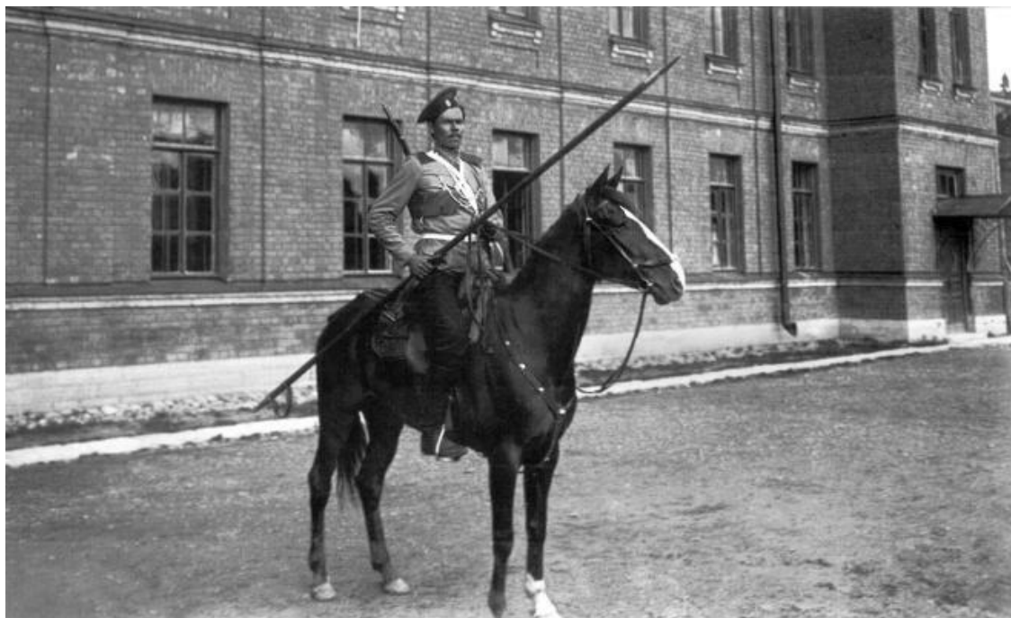
Казак лейб-гвардии Казачьего полка