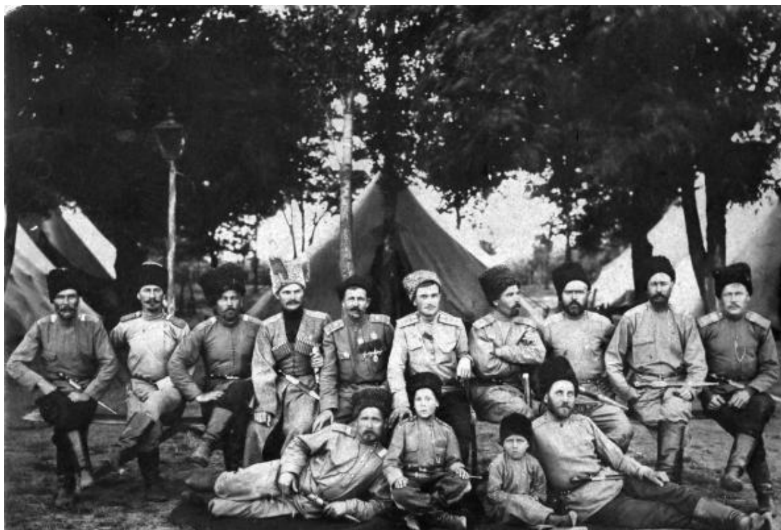
Кубанские казаки в мае 1916 года

Я поехал дальше. Однако мне все-таки надо было пробраться в штаб. Разглядывая старую карту этого уезда, случайно оказавшуюся у меня, советуясь с товарищем, с донесением всегда посылают двоих, и расспрашивая местных жителей, я кружным путем через леса и топи приближался к назначенной мне деревне. Двигаться приходилось по фронту наступающего противника, так что не было ничего удивительного в том, что при выезде из какой-то деревушки, где мы только что, не слезая с седел, напильсь молока, нам под прямым углом перерезал путь неприятельский разъезд. Он, очевидно, принял нас за дозорных, потому что вместо того, чтобы атаковать нас в конном строю, начал спешиваться для стрельбы. Их было восемь человек, и мы, свернув за дома, стали уходить. Когда стрельба стихла, я обернулся и увидел за собой на вершине холма скачущих всадников – нас преследовали; они поняли, что нас только двое. В это время сбоку опять послышались выстрелы, и прямо на нас карьером вылетели три казака: двое молодых, скуластых парней и один бородач. Мы столкнулись и придержали коней.