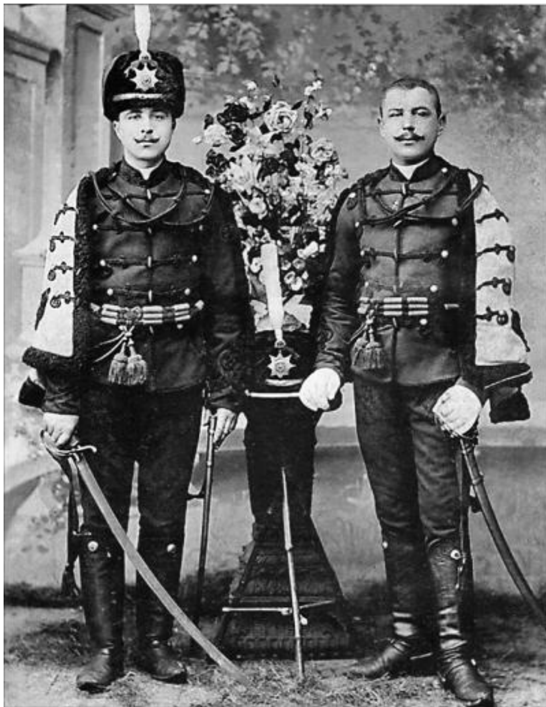
Нижние чины лейб-гвардии Гусарского полка в парадном обмундировании, 1910-е гг.