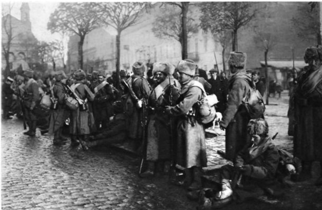
Русские войска в Варшаве