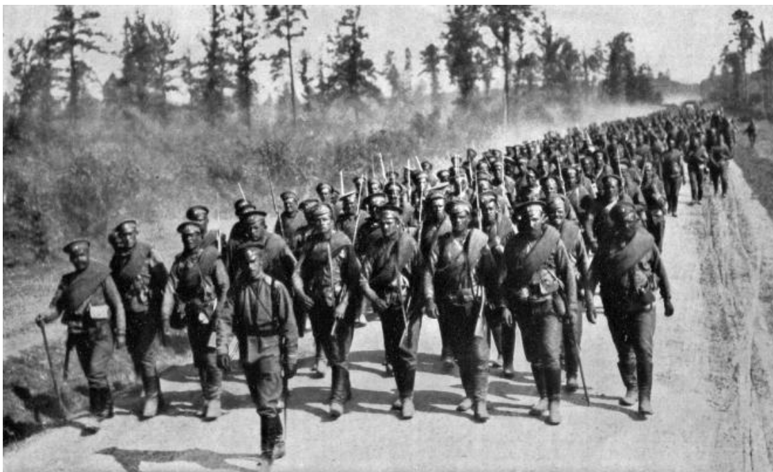
Отряд русских солдат, идущих на фронт

Предприняли мы однажды разведывательное наступление, перешли на другой берег реки Ш. и двинулись по равнине к далекому лесу. Наша цель была – заставить заговорить артилле-