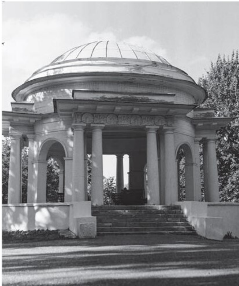
Ротонда в глубине Александровского сада