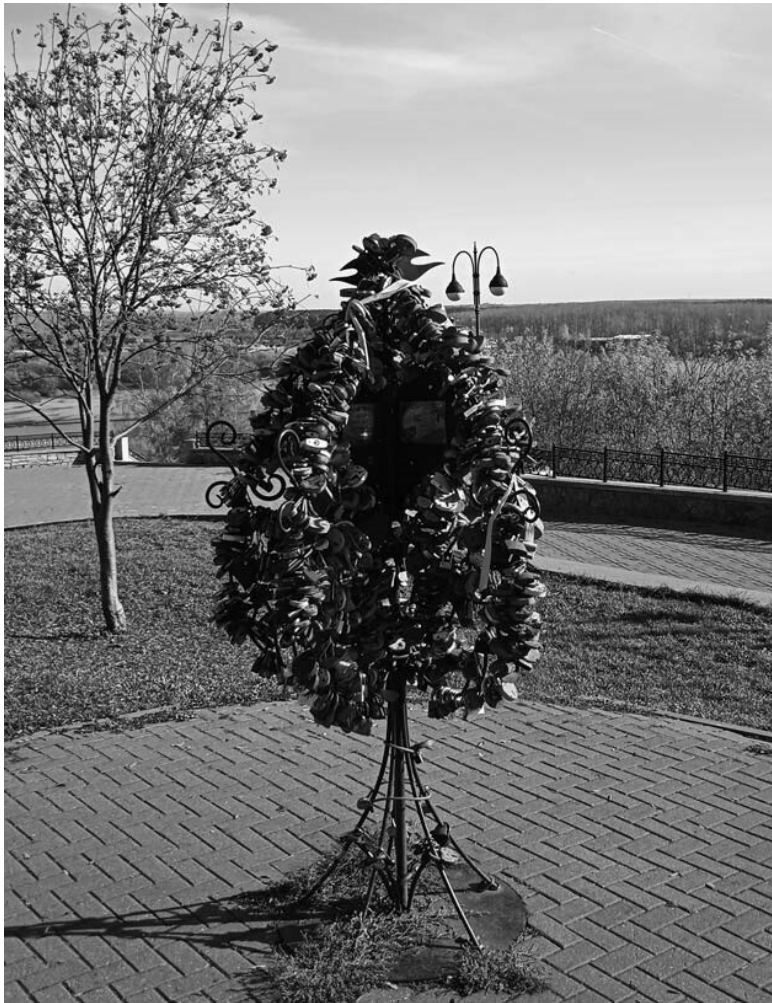
Конструкция для свадебных замочков