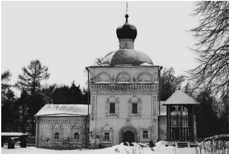
Церковь Михаила Архангела. Яранск. XVII век