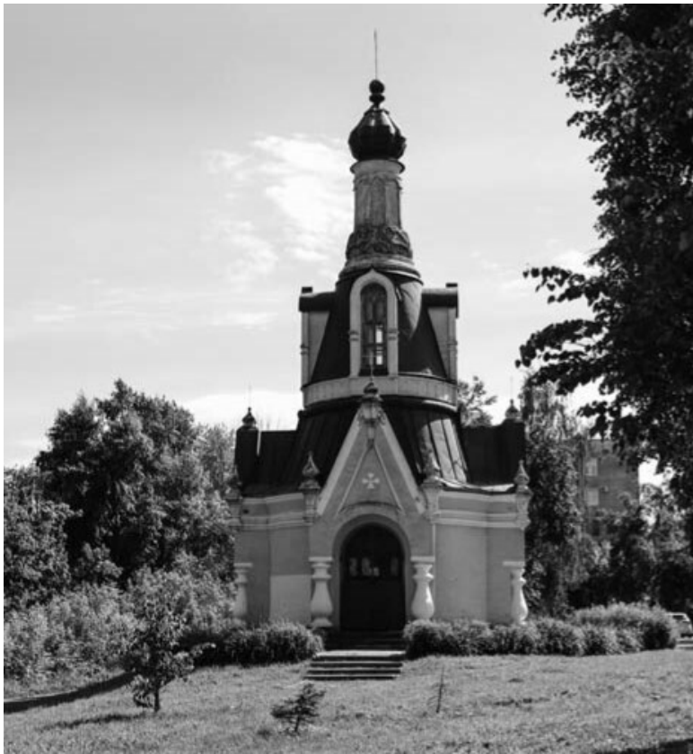
Раздерихинская часовня, воссозданная в 1 999 году вза- мен разрушенной в 1925-м