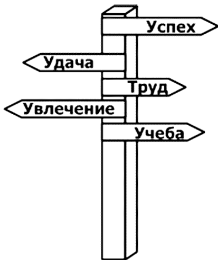
Рис. 2. Каждый человек выбирает свой путь

своей жизнью, делает сознательные выборы и меняет себя и окружающую реальность.