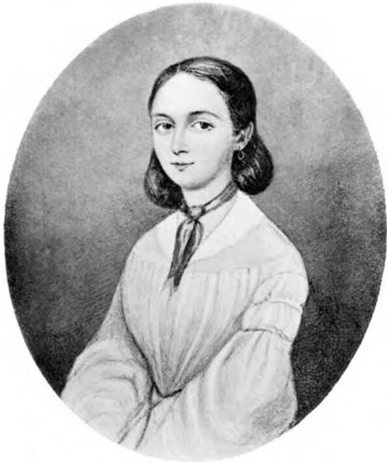
Елена Андреевна Ган, урождённая Фадеева (1814–1842), мать Е. П. Блаватской