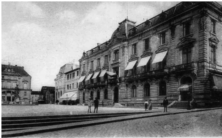
Мон-де-Марсан. Здание мэрии. Начало XX в.

Кроме того, мне очень понравилась Ольга, почти моя ровесница, с которой нам суждено было подружиться.