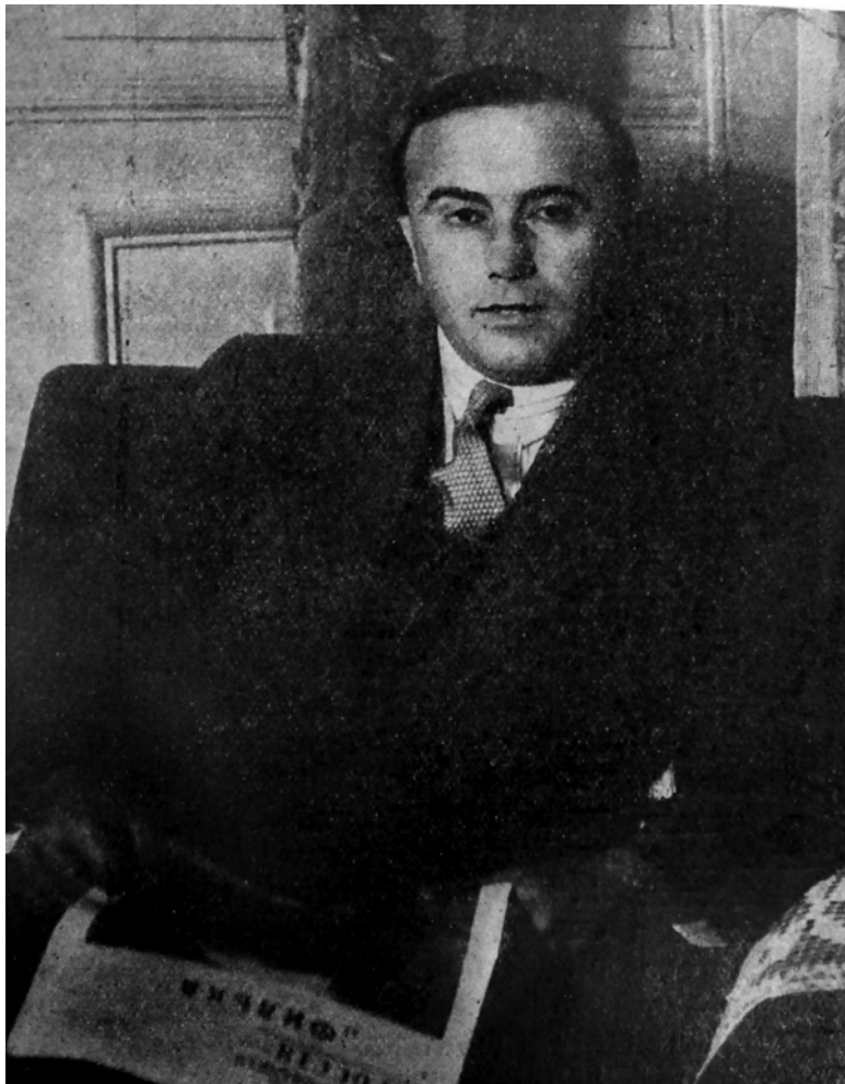
Григорий Беседовский после бегства из советского пол-