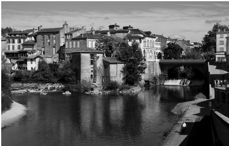
Мон-де-Марсан. 2018.