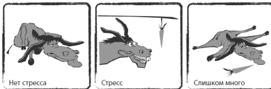
Рис. 1. Стресс и эффективность

Исследования показывают, что к болезни и смерти может привести не только избыток, но и недостаток стресса.