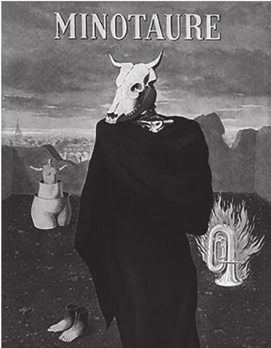
Рисунок 3. Обложка журнала «Минотавр» № 10, 1937 (автор обложки – Рене Магритт)

Эта история разделила Францию. Одни считали, что это проявление классовой ненависти, что наниматели эксплуатировали девушек и ни во что их не ставили. В конечном счете это спровоцировало выплеск классовой ненависти и насилия. Другая сторона считала, что это просто проявление психиатрического расстройства, которое до этого было скрыто.