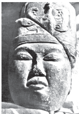
Голова Кюль-Тегина. VIII в.

Формально старшим в роду являлся Кара Чурина Тюрка – сын Истеми. Но его отец не был даже верховным каганом, и сыновья умерших верховных вождей – Муганя и Тобо – оспорили право Кара Чурина Тюрка на престол. Тот не мог сопротивляться объединившимся против него племянникам и временно смирился с поражением. Но победители немедленно передрались между собой. Вряд ли стоит описывать перипетии этой борьбы, но итогом ее стал окончательный раскол каганата в 604 году на Западный и Восточный.