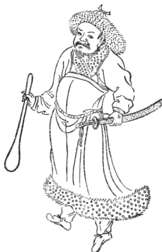
Монгол. Персидский рисунок XIV в.

историками все еще не решен. Более того, как правило, от него стараются дистанцироваться или не рассматривают вовсе, хотя для правильного понимания феномена империи Чингисхана он представляется весьма немаловажным.