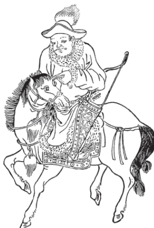
Монгол на коне. Персидский рисунок XIV в.

Ну а теперь, когда мы определились с тем, кого, собственно, можно считать монголами, посмотрим, что из себя представляли эти самые монголы.