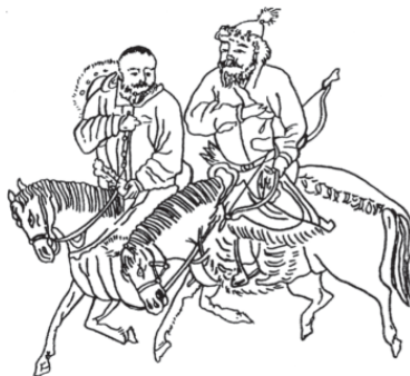
Монгольские кочевники. Китайский рисунок XIII в.

Естественно, если отказаться от божественной составляющей, то вызывает большой интерес, откуда в глубинах Центральной Азии в ту эпоху, никак не располагавшую к далеким путешествиям, мог взяться человек столь явно европейской внешности. Однако оставим разгадку этого феномена авторам исторических романов. Для нас же важно, что именно эти события привели к окончательному разделению монголов на две ветви. Потомство Алан-Гоа стало называться «нирун», все остальные монголы – «дарлекин». При этом в подвешенном состоянии оказались потомки двух старших сыновей – их то относили к ветви нирун, то отказывали в этом звании.