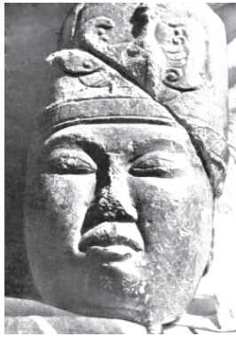
Голова Кюль-Тегина. VIII в.

Увлеченные междоусобной борьбой, тюркские каганы допустили еще одну, как выяснилось, роковую ошибку: проглядели, что на их южной границе в крови и войнах встанет на ноги колосс – объединенный Китай. В начале VII века после продолжительной борьбы к власти во всем Китае пришла династия Тан. Немаловажным оказалось и то, что новая династия не была собственно китайской, а происходила от окитаившейся ветви протомонгольского племени тоба – теперь они назывались табгачи. Многие степные народы, особенно те, кому поперек горла встала тюркская власть, с удовольствием приняли табгачских императоров в качестве степных ханов. Этому способствовала и политика дальновидного танского императора Ли Ши-миня, стремившегося привлечь степные племена на свою сторону и даже больше