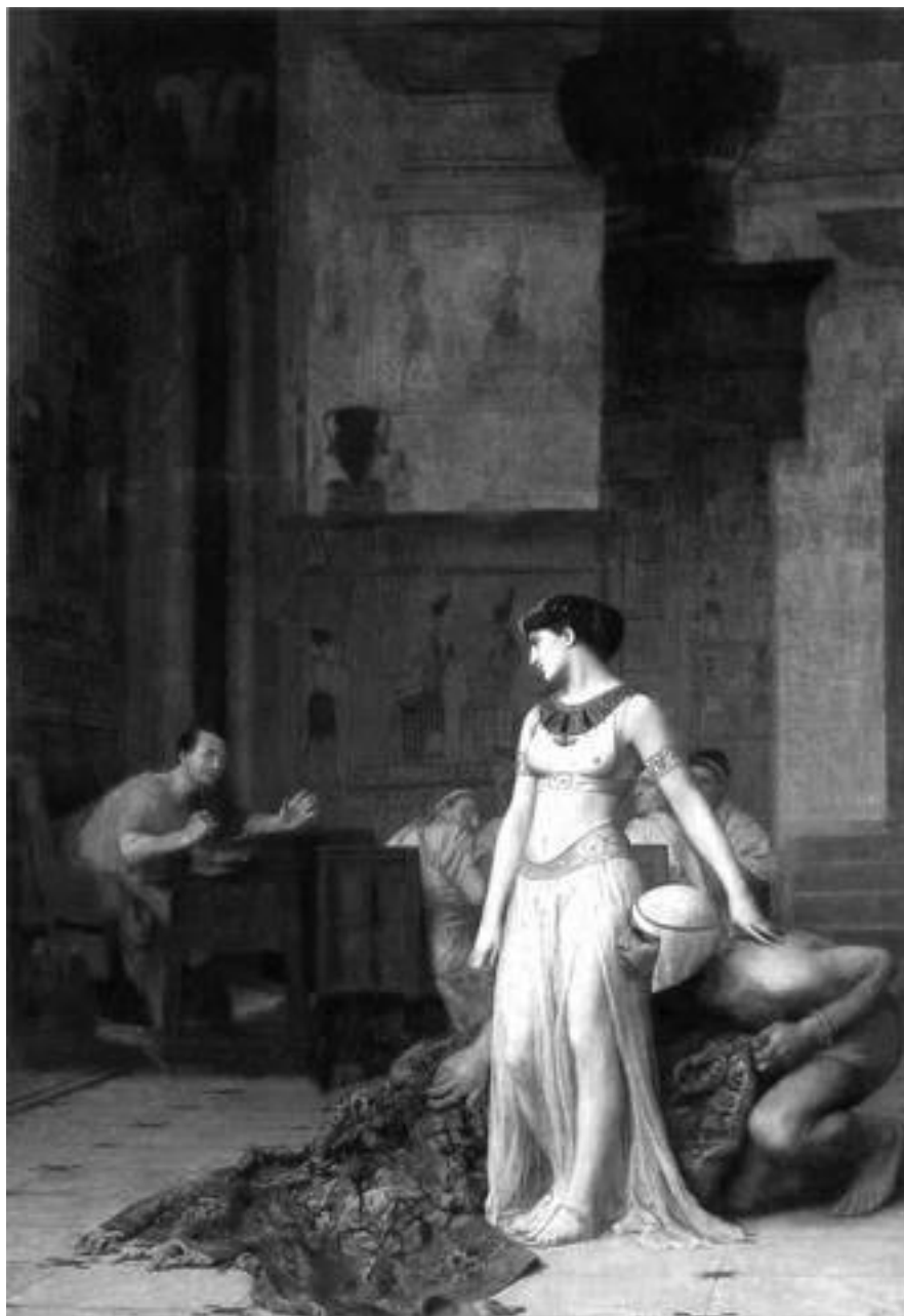
Ж.-Л. Жером. Клеопатра и Цезарь. 1866

Конечно, в ведьму верится с трудом. Но что нам известно о Клеопатре доподлинно? Школьные учебники рассказывают, что правительница-египтянка родилась 2 ноября 69 года до н. э. и скончалась в 30 году до н. э. Она прожила 38 лет, ее полное тронное имя – Клеопатра VII Филопатор. Но если чуть отойти от школьных познаний, всплывают иные факты. Начнем с того, что Клеопатра не была египтянкой, она – гречанка. Отец ее, египетский царь Птолемей XII Авлет, происходил из династии Птолемея – любимого военачальника самого Александра Македонского. Мать же Клеопатры вообще являлась простой наложницей. И это отодвигало дочь и от трона, и от жреческого сословия. То есть никаких секретов магии «страшных египетских богинь» она ни знать, ни использовать не могла.