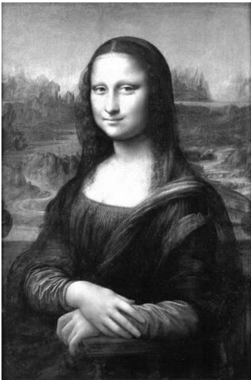
Л. да Винчи. Портрет госпожи Лизы Джоконды. Мона Лиза. 1503–1505

Что ж, величайший мастер Возрождения Леонардо да Винчи действительно дописывал некий портрет молодой женщины всю свою жизнь, так и не закончив его. Но была ли то мона Лиза и что вообще известно нам об этой женщине?