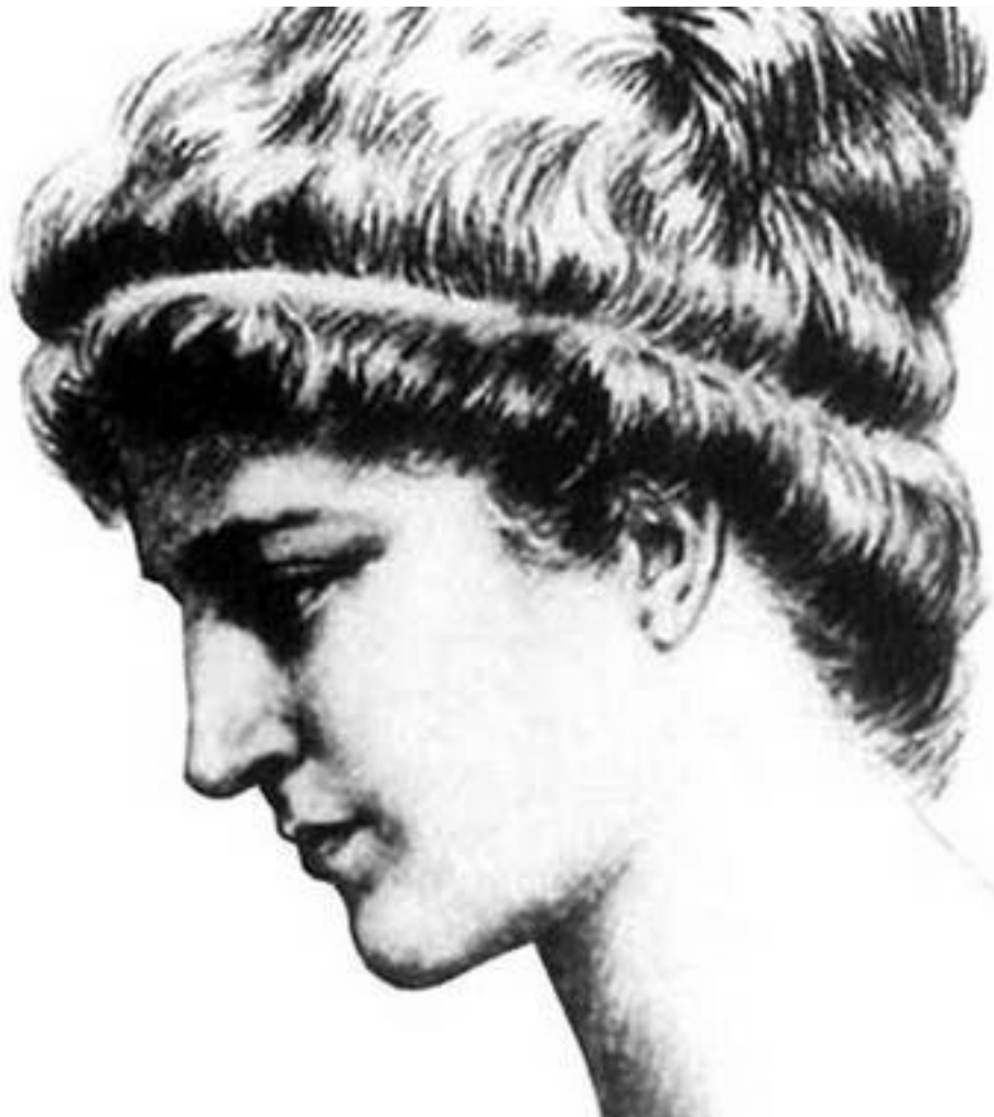
Портрет Ипатии (Гипатии) из Александрии. 1908

Она родилась примерно в 370 году в Александрии – отсюда и ее прозвание Александрийская дева. В то время родной город нашей героини, стоявший в дельте Нила в Египте, считался эллинистическим по культуре, ибо был основан самим Александром Македонским (332 до н. э.).