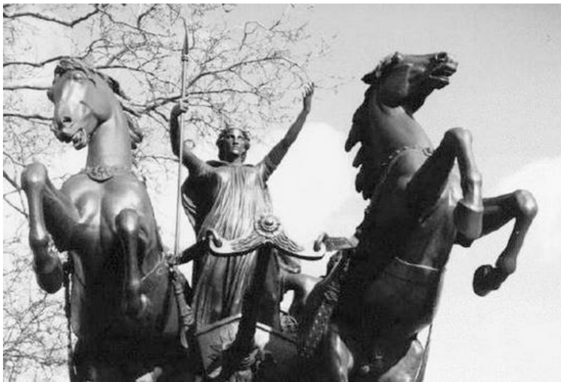
Статуя Бодикки около Вестминстера

Увы, у царской четы Прасутага и Бодикки были только две дочери. Когда Прасутаг умер, а тело его едва успели предать земле, в столицу иценов (она находилась на территории современного пригорода Норфолка, что в Восточной Британии) нагрянул посланник командующего 9-м римским легионом Квинта Петилия Цериалиса. Без почтения к горю Бодикки, ее дочерей и всех иценов он объявил, что отныне все имущество царской семьи, все земли иценского народа, как и сам народ, – все по закону принадлежит римскому императору.