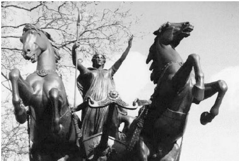
Статуя Бодикки около Вестминстера

Увы, у царской четы Прасутага и Бодикки были только две дочери. Когда Прасутаг умер, а тело его едва успели предать земле, в столицу иценов (она находилась на территории современного пригорода Норфолка, что в Восточной Британии) нагрянул посланник командующего 9-м римским легионом Квинта Петилия Цериалиса. Без почтения к горю Бодикки, ее дочерей и всех иценов он объявил, что отныне все имущество царской семьи, все земли иценовского народа, как и сам народ, – все по закону принадлежит римскому им-