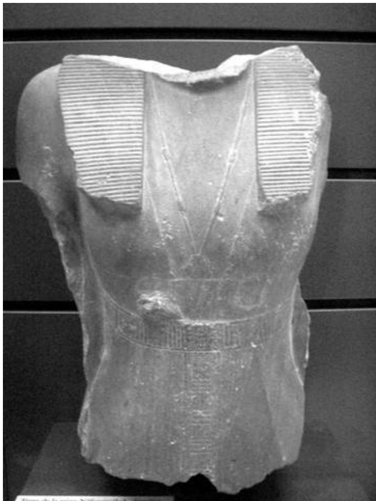
Fragment of a shendyt, Nubia, 18th Dynasty.