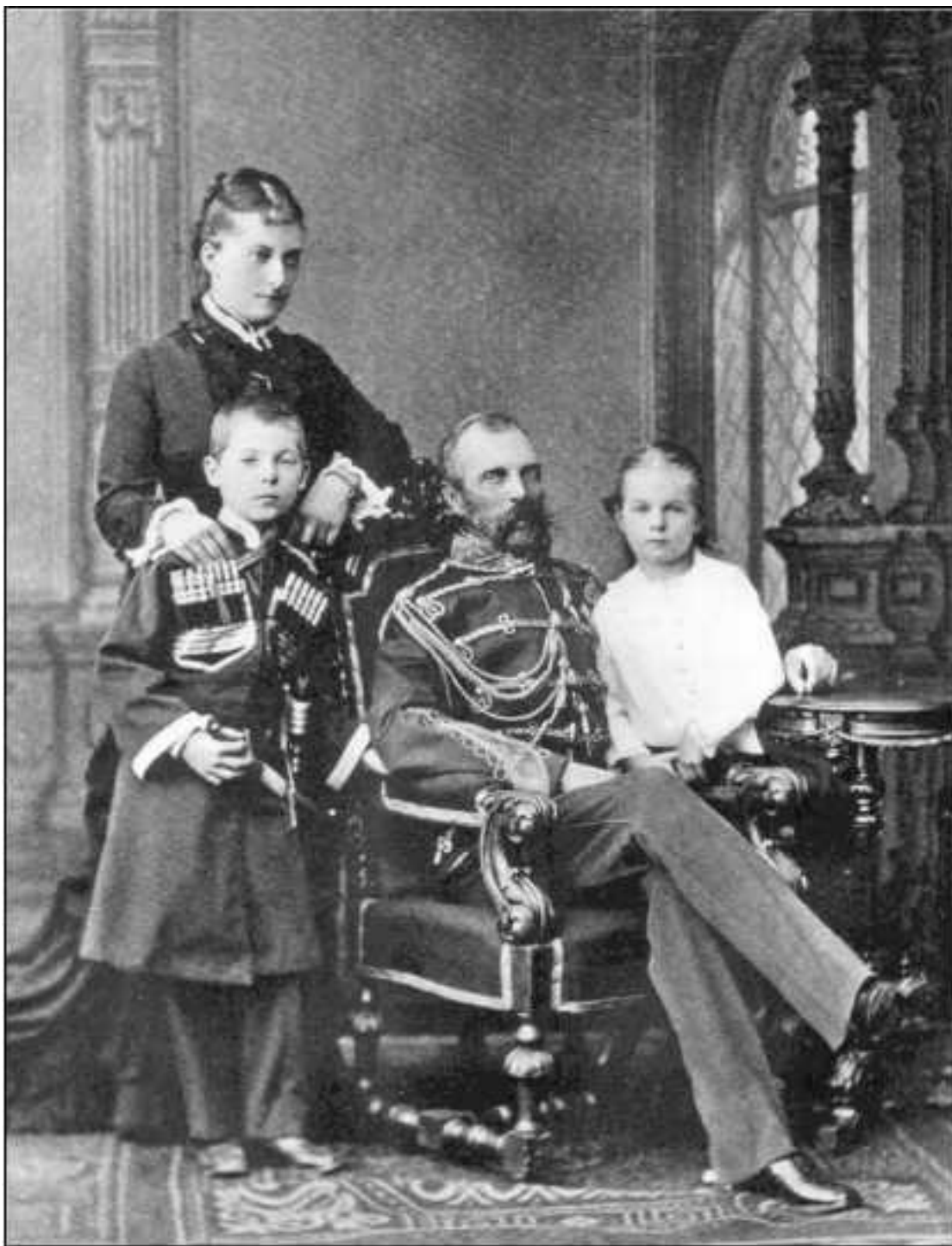
Император Александр II со второй супругой Екатериной Долгорукой и детьми

6. Чрезвычайно важное геополитическое значение с точки зрения размещения летней резиденции имело присутствие на Крымском полуострове агрессивно или нейтрально настроенных коренных этнических групп населения, среди которых преобладали так называемые крымские татары, греки-туркофоны, урумы и караимы. Крымские татары как самостоятельный этнос сформировались в Крыму в XIII–XVII веках. Историческим ядром крымско-татарского этноса являются тюркские племена из кипчако-огузской группы, осевшие в Крыму, которые смешались с местными потомками гуннов, хазар, печенегов, а также представителями дотюркского населения Крыма. После окончания Крымской войны (1853—25.02.1856) начался массовый исход в Турцию крымских татар (около 198 тысяч человек) и принудительное выселе-