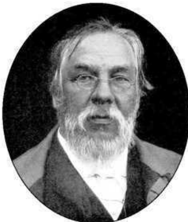
Русский врач-терапевт и общественный деятель Сергей Петрович Боткин

Замечу, что жена императора Александра II – Мария Александровна родила царю семейных детей. Роды и склонность императрицы к простудам сделали свое дело, и во второй половине 60-х годов это была больная, психологически сломленная смертью старшего сына женщина, муж которой больше времени уделял фавориткам, чем здоровью жены. 22 ноября 1870 года высочайшим указом Александра II врач С.П. Боткин назначается почетным лейб-медиком, а главным объектом его забот и лечения становится императрица Мария Александровна.