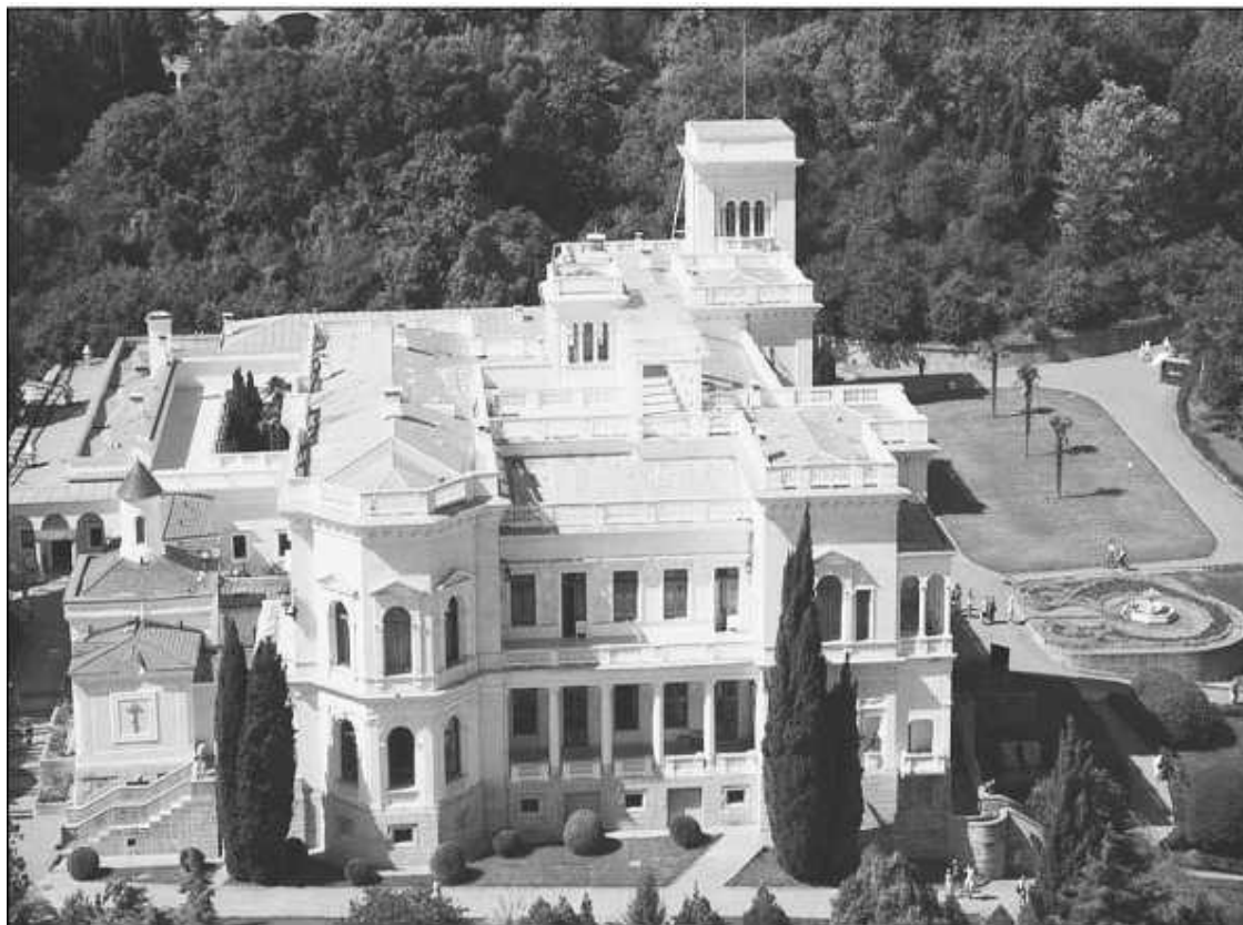
Белый дворец в имении Ливадия, созданный по проекту Н.П. Краснова. Фото 2009 года