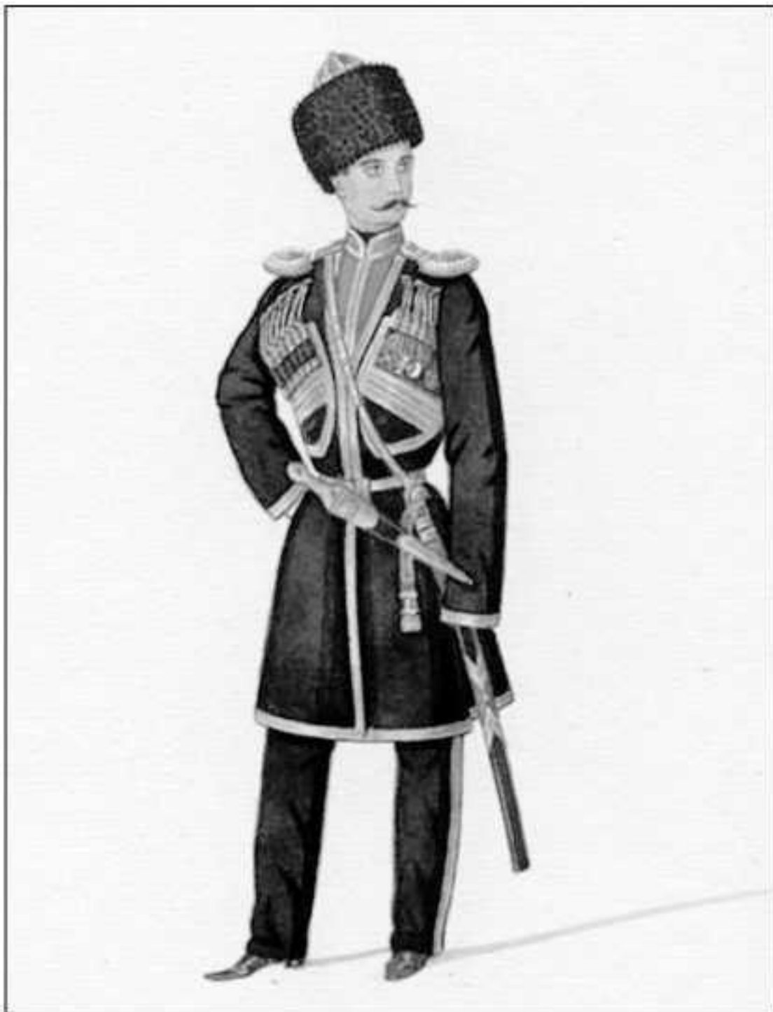
Лейб-гвардии Кавказский казачий эскадрон СЕИВ конвоя. Ober-офицер в обыкновенной форме. Ливадия, 1864 год