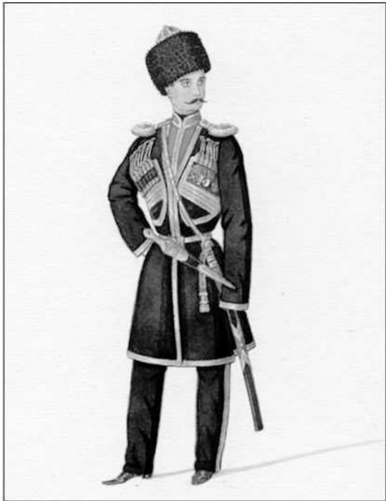
Лейб-гвардии Кавказский казачий эскадрон СЕИВ кон-