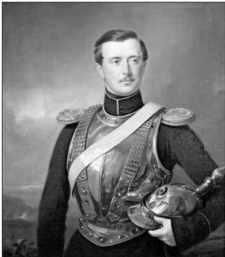
Петр Андреевич Шувалов – генерал-адъютант, генерал от

шефа жандармов, очевидно, было главное», – утверждал в своих воспоминаниях П.А. Валуев.