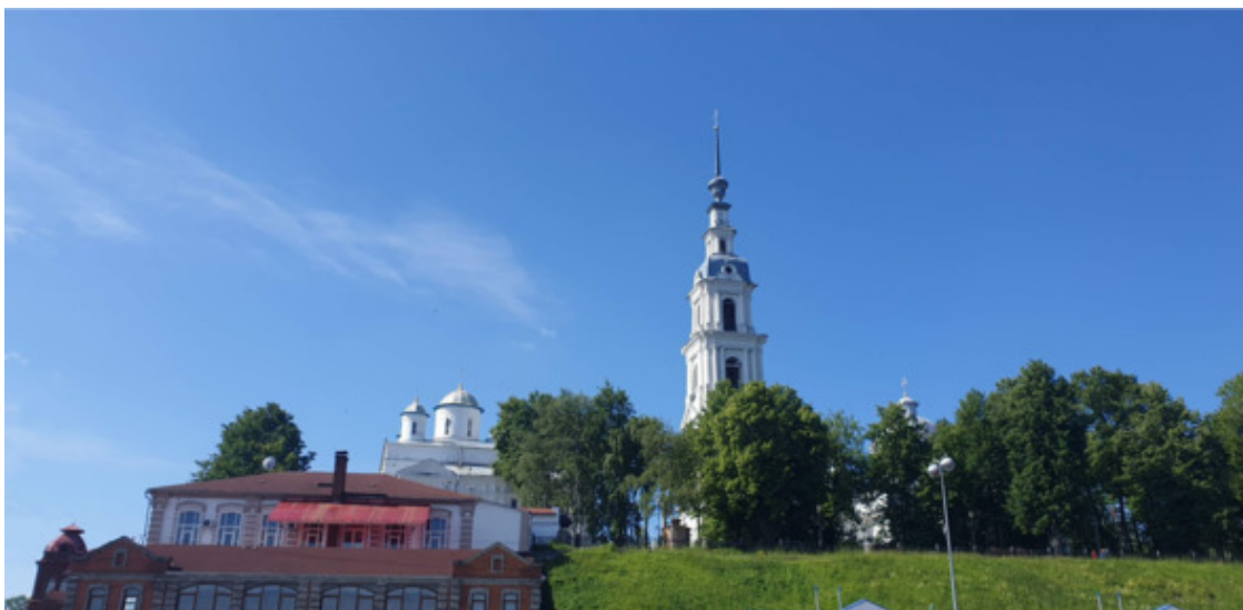
Кинешма, Троицко-Успенский кафедральный собор

В 1777 году Кинешма приобретает статус уездного города, а вскоре и собственный герб. Происходит это во время правления Екатерины Великой, которая, путешествуя по Волге, обратила внимание на вид города и повелела изобразить на гербе «корму галерную с тремя фонарями и с опущенными лестницами в голубом поле. Во второй части, в зеленом поле, два свертка полотна, в знак того, что сей город оными производит торг» . Кроме торга славилась Кинешма своими солеварнями, мастерами по металлу и скорняками. А с середины XVIII-го века заработали в городе первые фабрики.