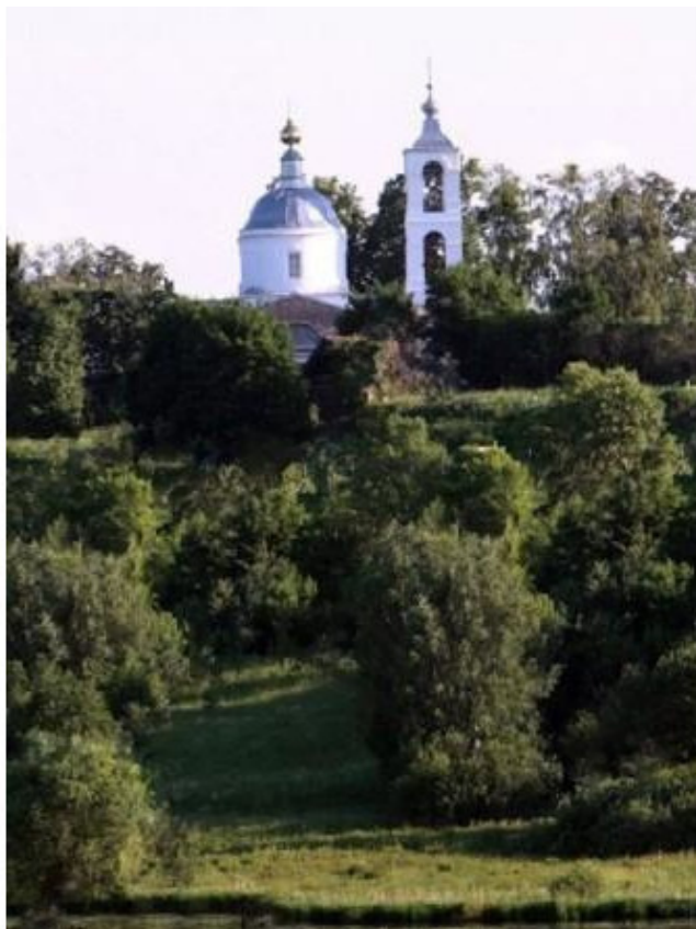
с. Стрелка, ц. Петра и Павла

В XIX веке старую церковь разобрали, а над могилой Александра Ильича поставили часовенку. После 1917-го кому-то очень понадобилось перенести часовню в другое место и разместить в ней очередной склад. Что стало с могилой, не известно. В начале XXI века на средства потомков «усмирителя Пугачевского бунта» в Стрелке поставили памятную часовню.