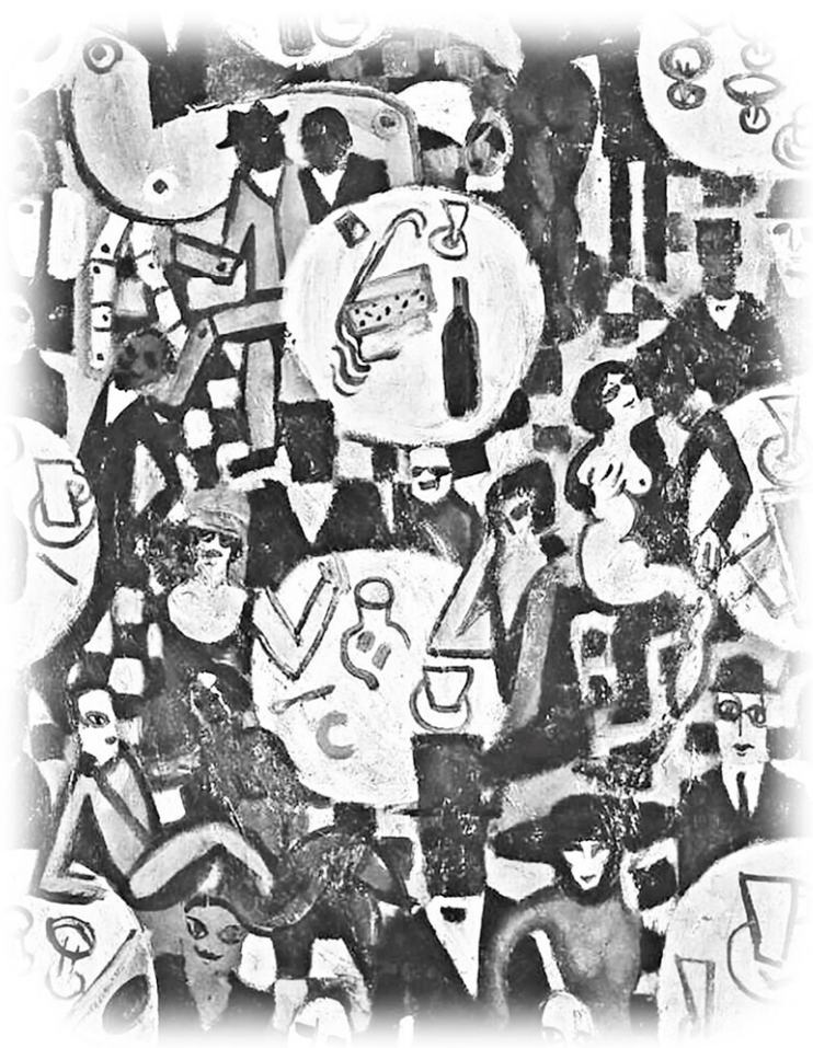
Сцена в кабаре