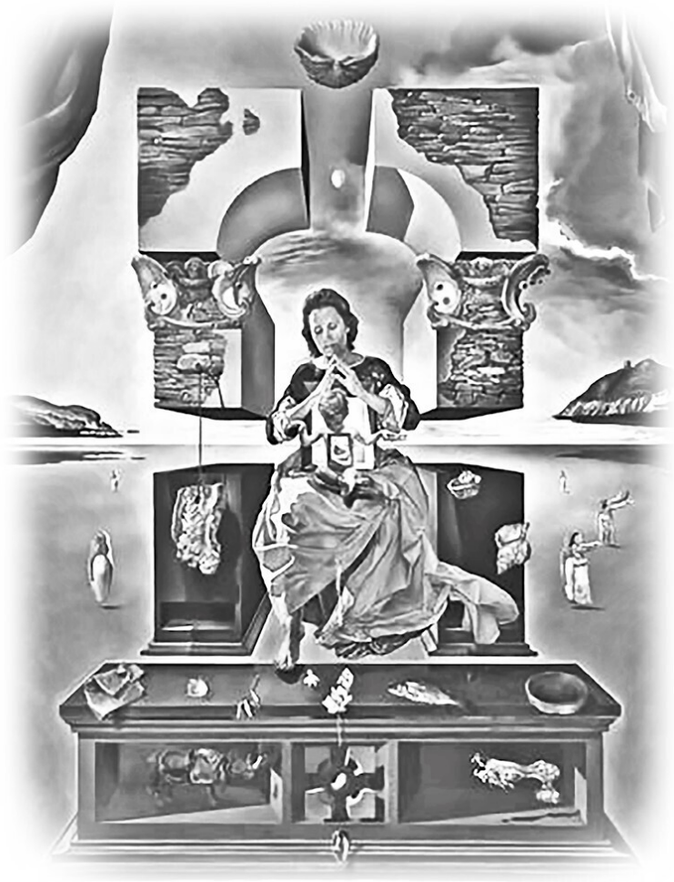
Мадонна Порт-Льигата (2-ая версия)