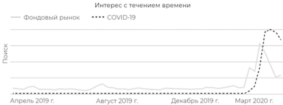
Рис. 1.1. Поиск в Google за период с апреля 2019 г. по апрель 2020 г. по ключевым словам «COVID-19» и «фондовый рынок». Как видите, существует четкая корреляция. По мере того, как падение фондового рынка попадало в новостные циклы, люди начинали все чаще и чаще искать информацию о фондовом рынке в Google.

Самое примечательное наблюдение, которое я сделал на основании рис. 1.1, состоит в том, что наибольший интерес к рынку акций у людей вызвал именно обвал фондового рынка. Эта корреляция на самом деле прослеживается почти при каждом предыдущем рыночном падении, включая финансовый кризис 2007–2008 гг. и взрыв «пузыря доткомов» в 2000 г., причем в последнем случае лопнули чрезмерно переоцененные акции интернет- и технологических компаний.