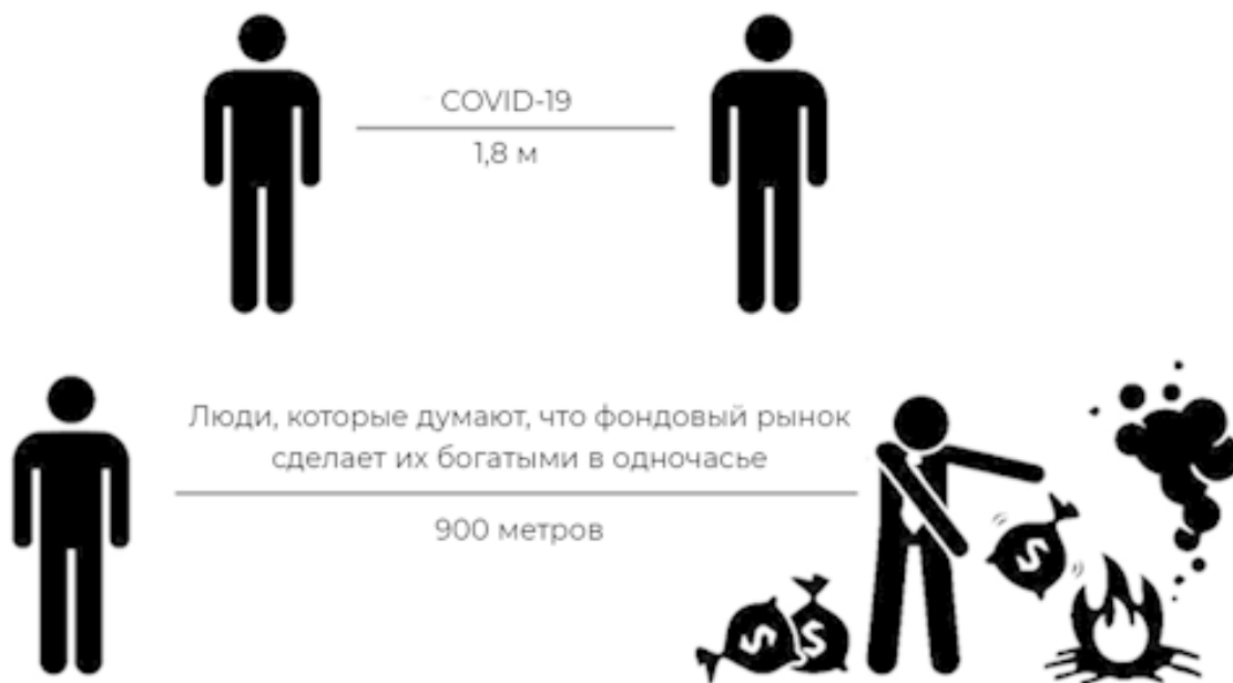
Рис. 1.4. Графические рекомендации по социальному дистанцированию, связанные с COVID-19 (для защиты вашего здоровья), и рекомендации по социальному дистанцированию от тех, кто предлагает сделать вас богатым в одночасье посредством игры на фондовой бирже (для защиты ваших денег).

так просто, каждый был бы успешным трейдером и мы не имели бы фактов ежегодного высокого процента неудач. Вы всегда должны помнить, что дейтрейдинг сложен и не сделает вас богатым очень быстро. Если вы находитесь в плену такого заблуждения и если хотите быстро и легко разбогатеть на фондовом рынке, вам следует прекратить читать эту книгу прямо сейчас и потратить сбережения, отложенные для игры на бирже, на приятный семейный отдых. Уверю вас, это будет лучшим способом потратить деньги, нежели потерять их на бирже.