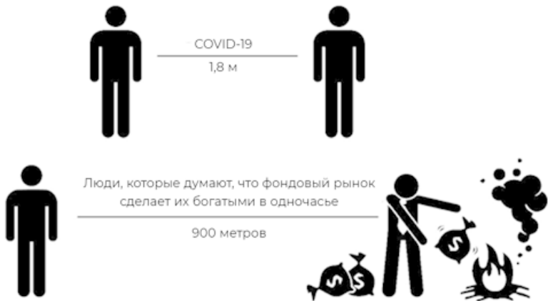
Рис. 1.4. Графические рекомендации по социальному дистанцированию, связанные с COVID-19 (для защиты вашего здоровья), и рекомендации по социальному дистанцированию от тех, кто предлагает сделать вас богатым в одночасье посредством игры на фондовой бирже (для защиты ваших денег).

Даже с учетом всех этих моментов дейтрейдинг все же может стать прибыльной профессией. Но имейте в виду, что требования для этой профессиональной карьеры весьма высоки и это уж точно не способ убивания времени для новичков. Чтобы стать стабильно прибыльным трейдером, требуется приложить немало усилий. Многие трейдеры неизменно потерпят неудачу на длинной и порой фатальной кривой обучения дейтрейдингу.