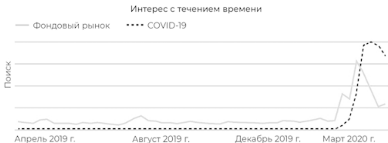
Рис. 1.1. Поиск в Google за период с апреля 2019 г. по апрель 2020 г. по ключевым словам «COVID-19» и «фондовый рынок». Как видите, существует четкая корреляция. По мере того, как падение фондового рынка попадало в новостные циклы, люди начинали все чаще и чаще искать информацию о фондовом рынке в Google.

соприкасается с событиями, происходящими на Уолл-стрит и других международных финансовых рынках.