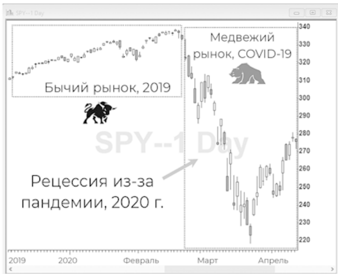
Рис. 1.2. Сравнение бычьего рынка 2019 г. и медвежьего рынка 2020 г. на основании стоимости акций 500 крупнейших американских компаний. Эти акции отслеживаются в индексе S&P 500, который торгуется, как инструмент биржевого фонда SPDR S&P 500 ETF Trust (тикер: SPY). Отслеживанием индекса занимается рейтинговое агентство Standard & Poor's

Волатильность рынка весной 2020 г., конечно же, возникла в результате пандемии COVID-19, которая привела к ужасно болезненной глобальной рецессии, как показано на рис. 1.2 при сравнении бычьего рынка 2019 г. и медвежьего рынка 2020 г. Именно в периоды сильного медвежьего тренда события фондового рынка обычно попадают в заголовки