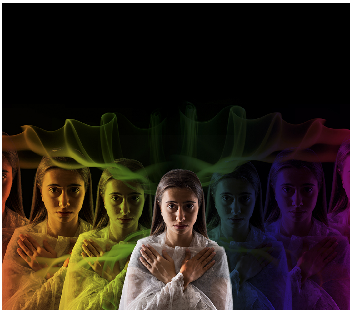
Рис.7. Энергетический двойник

Вернемся к нагуалью. Мир неопишуемых свойств, мир того, что нельзя назвать словами. Тогда как нам говорить о нагуале? Никак. О нагуале нет смысла говорить, потому что слова принадлежат тоналю и могут описать лишь что-то, относящееся к привычному миру. Нагуаль можно только ощутить, а когда он придет, сомнений не возникнет. В обычной жизни нагуаль иногда пробивается в наше сознание в виде предчувствий, интуиции и чувств, которые невозможно описать, потому что для них нет слов.