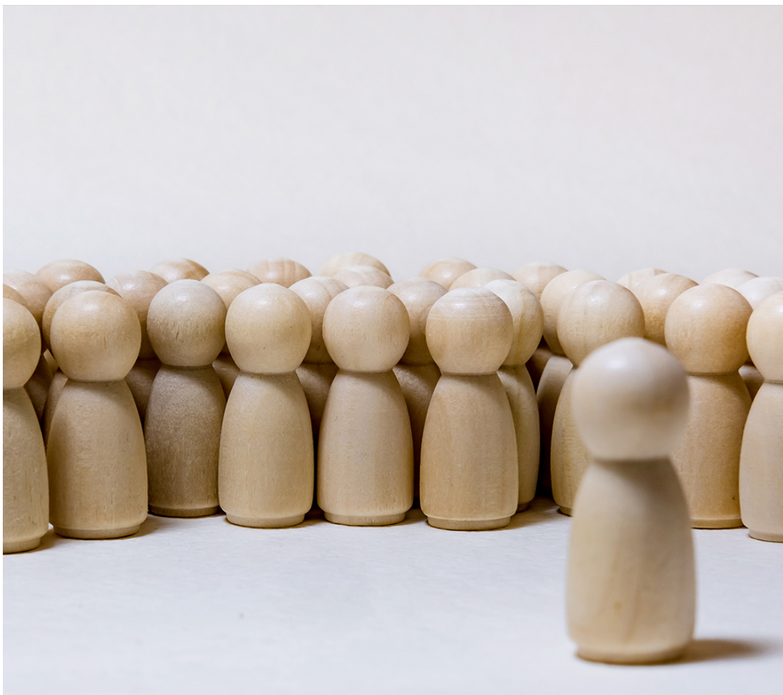
Рис. 10. Человек в социуме

Разум, ум, рациональность – основная составляющая часть нашей картины мира. Куда бы мы ни обратили взор, сразу же начинает действовать разум. Сначала он воспринимает информацию, потом оценивает, относится ли информация к известному или неизвестному. Если информации соотносится с шаблоном, уже существующим в голове, она легко воспринимается и добавляется к тому, что уже «лежит на полке» ума. Если же полученные сигналы внешнего мира, неважно в каком виде они пришли, не имеют соотношения с известным в нашей голове, то они, скорее всего, отбрасываются и остаются незамеченными. В крайнем случае, когда от таких сигналов нельзя отмахнуться, разум быстро создает для них новый шаблон и опять «кладет на полку». Таким образом, все неизведанное и непознанное становится понятным, даже скучным, обыденным, либо не остается в памяти.