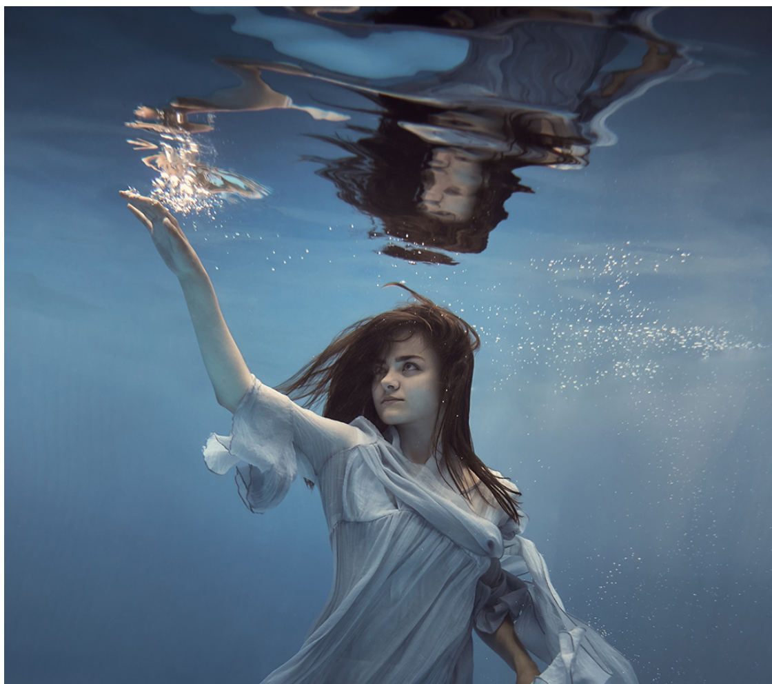
Рис.6. Тональ и нагуаль

Наш мир делится на два острова: известные нам предметы, явления и существа и неизвестные области мироздания, о которых наш ум никогда не слышал и не знал. Некоторые из этих областей так и останутся неизвестными, потому что человеческая форма имеет ограничения и не может воспринимать все грани мира. Эти грани мира философы называют «непознанное», а индейцы Мексики используют термин «нагуаль». Но среди неизвестного есть и то, что мы можем узнать и воспринять, и этого вполне достаточно для одной человеческой жизни.