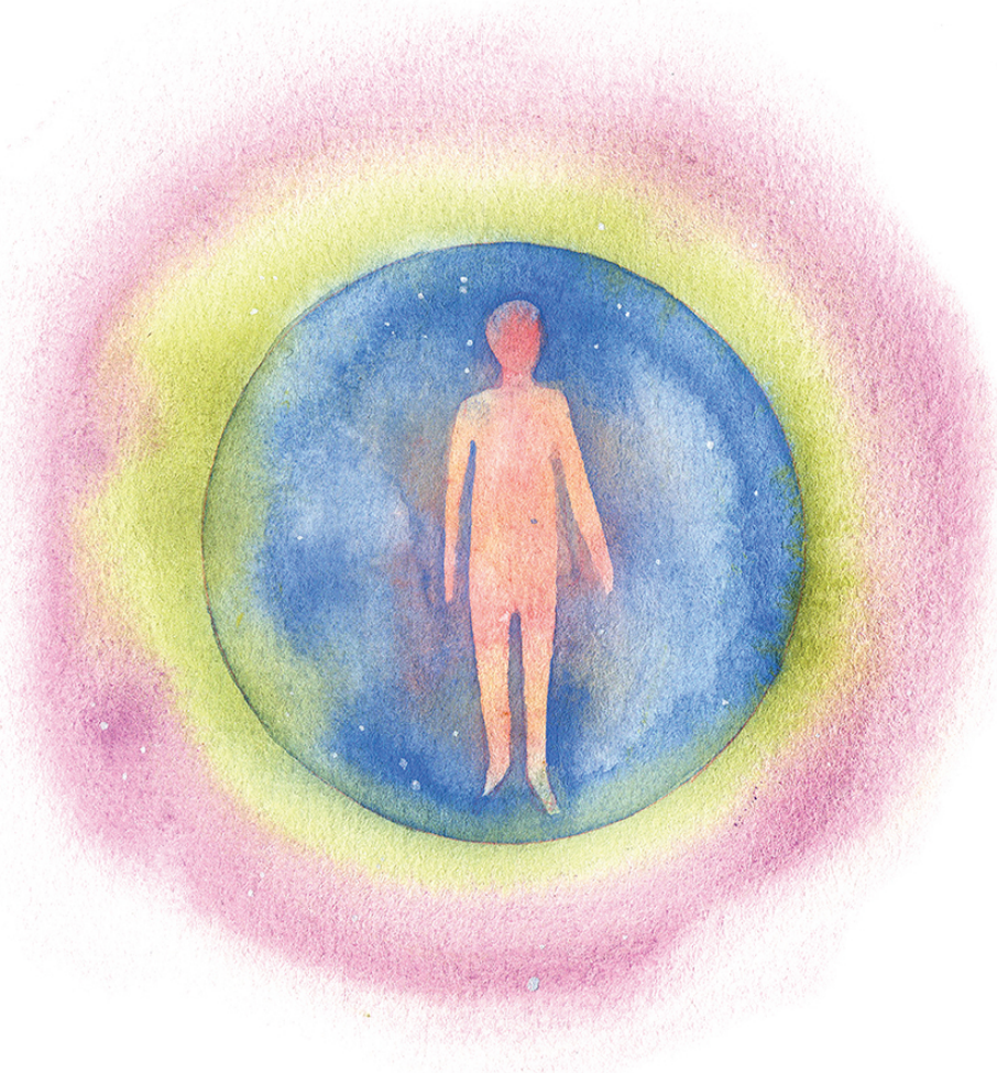
Рис. 2. Энергетическое тело человека (кокон)

Тела состоят из молекул, а молекулы из атомов, где электроны вращаются на некотором расстоянии от протонов. Так вот, это расстояние сопоставимо с расстоянием между звездой и планетами. Таким образом, в нашем теле намного больше пустого пространства, чем чего-то твердого. Впрочем, и сам протон и электрон не имеют отношения к твердости, это всего лишь частицы с определенным зарядом.