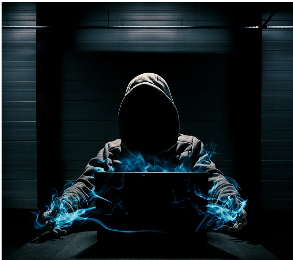
Рис. 11. Матрица

В книге Кастанеды есть описание человеческого шаблона, или человеческой матрицы. Это энергетический образец, который служит для «штамповки» людей. Видящие энергию маги узнали, что шаблон служит образцом для человеческой формы и так совершенен, что на первый взгляд похож на всемогущего бога. Он светится, излучает добро и мудрость, кажется наполненным силой. Когда ученики дона Хуана встречались с ним, то принимали за творца всего сущего. Но это всего лишь штамп, матрица, которая отвечает за форму человека.