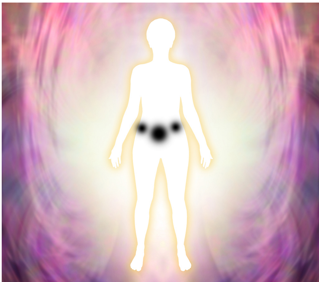
Рис.8. Дыры в коконе

Тема нашей сегодняшней беседы будет довольно печальной и для кого-то, возможно, шокирующей, но избежать ее нет никакой возможности. Особенно для тех, кто принял решение сделать шаг в неизвестное и отправиться исследовать другие миры. Для того чтобы немного сдвинуть точку сборки, хватит сил у каждого, а вот, чтобы значительно измениться, трансформировать свое тело в целостное существо, потребуется вся свободная энергия. Есть две стороны управления энергией.