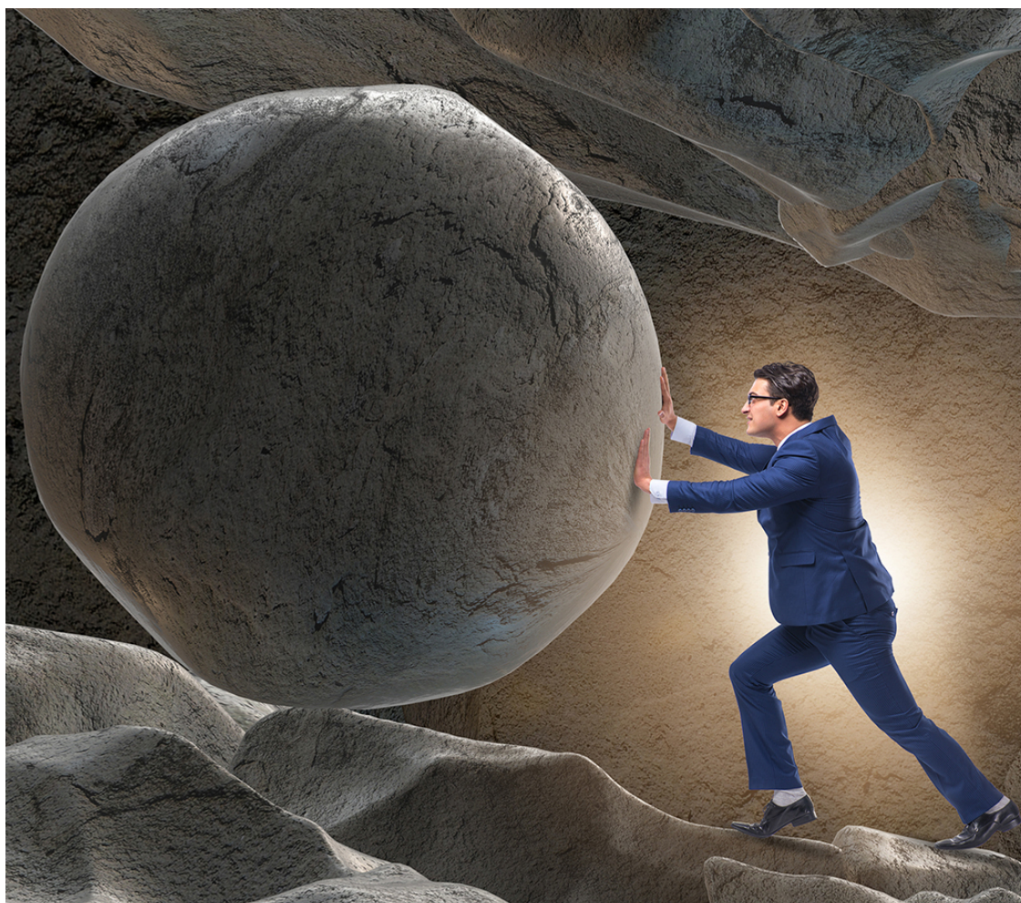
Рис. 9. Карма

От слова «карма» многим хочется отвернуться. Сразу в голове появляются ассоциации с восточными религиями, назойливыми сектантами или преданными служителями Кришны. Попробуем абстрагироваться от навязчивого шаблона. Карма в энергетическом мире несет совсем другие нагрузки, никак не связанные с религиозными представлениями, или богами, но