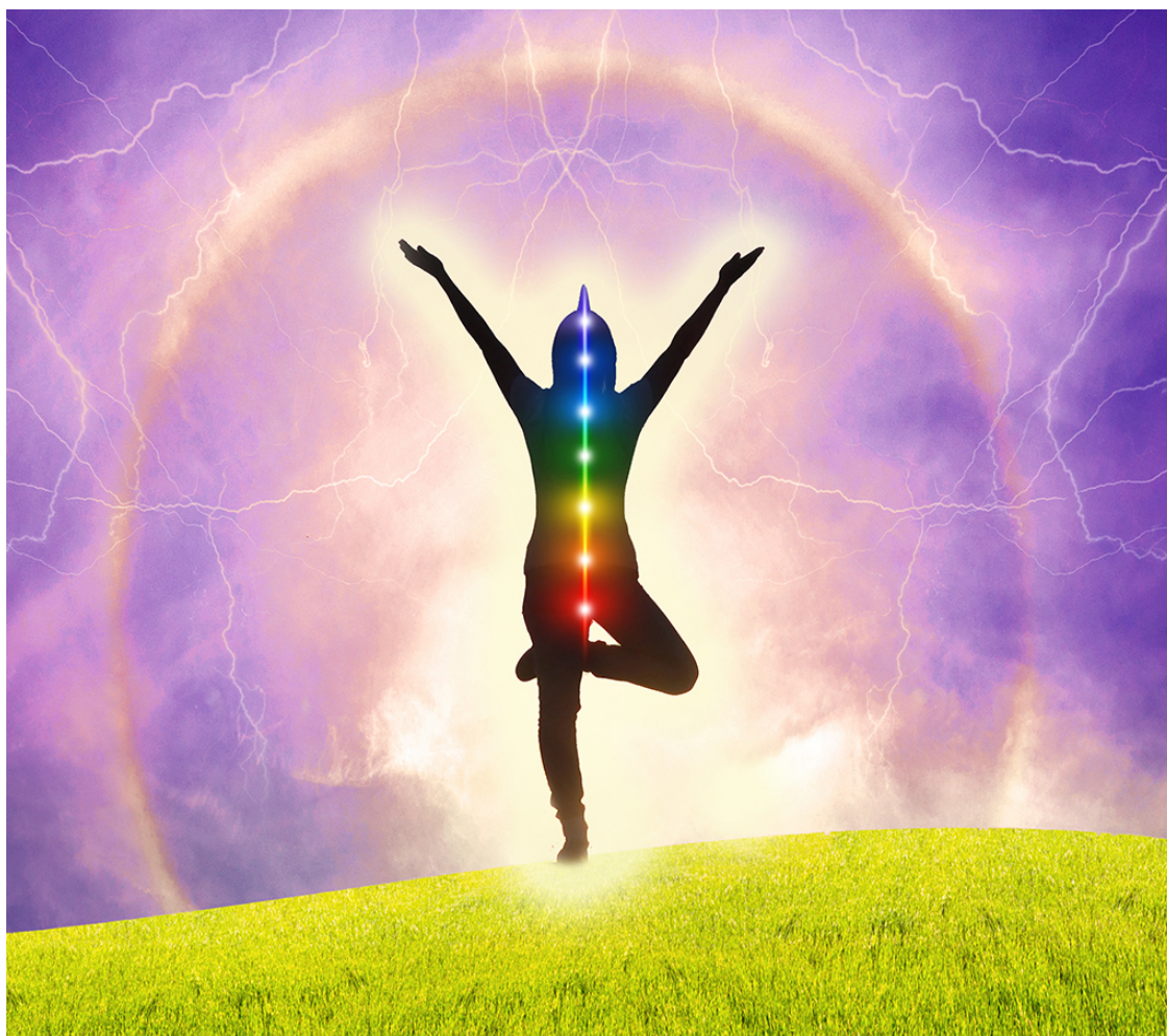
Рис. 4. Светящийся кокон человека

Действительно, светящийся кокон есть у всех. Это прозрачная структура, существующая вокруг каждого живого существа. Форма и внутренняя структура могут различаться у разных существ, но все они будут приближаться к яйцевидной форме, это общий признак жизни на планете Земля. В других пространствах такой формы может не быть. Кокон похож на оболочку, внутри которой есть яркий светящийся стержень. Фиксация на определенном месте этого стержня определяет, какой мир мы видим. Кокон дерева огромный, они могут быть по размеру больше пятиэтажного дома. Это легко ощутить, находясь под кроной дерева и включив видение энергии. А вот человеческий кокон намного меньше и распространяется над головой, вокруг туловища и примерно до колен. Руки и ноги выходят за пределы кокона.