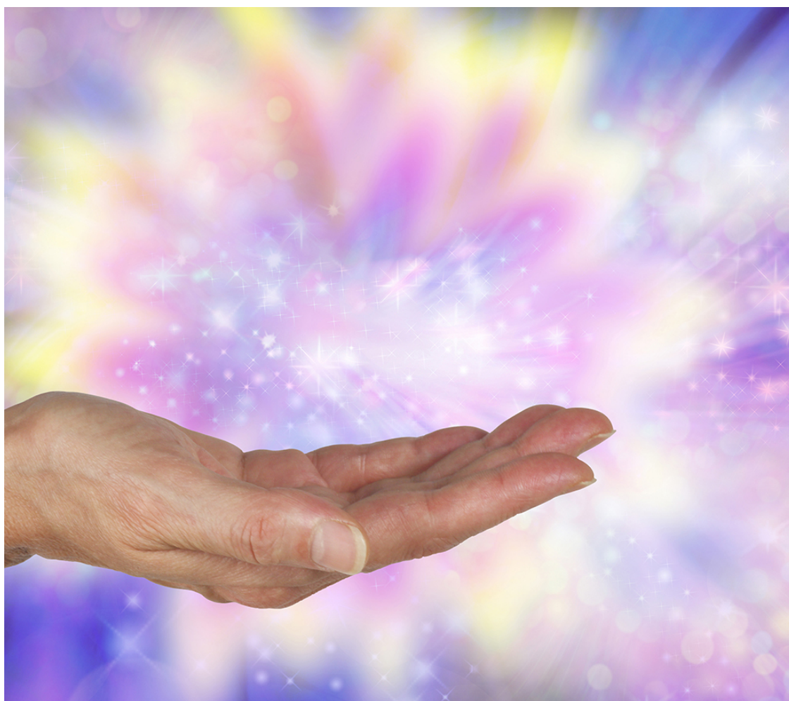
Рис.3. Мир энергии

Если мир состоит из энергетических потоков, то, что представляет собой человек в таком мире? На что похожи другие существа: животные, растения, насекомые? Как выглядит Земля? Эти вопросы первыми пришли мне в голову, когда я увидела энергию. Наверняка вы слышали о светимости человека, о его ауре, представляющей яйцевидную форму или кокон. Некоторые «умельцы» даже берутся за деньги исправить деформацию кокона и наполнить его светом в тех местах, где он «загрязнился». Обычный человек воспринимает такие предложения как шарлатанство и он прав. Ни один из тех «магов», что обещает исправить вашу судьбу за умеренную плату, никогда не расскажет вам правды. Либо потому что сами ее не знает, либо потому что не захотят нанести вам травму. Правда, которую знает видящий, на самом деле очень печальна. Но начну с самого начала.