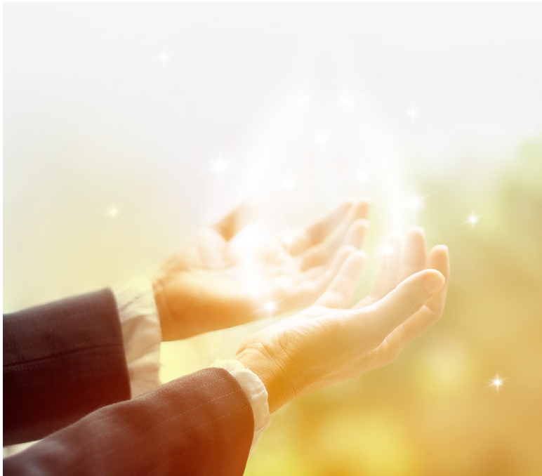
Рис. 1. Аура на руке человека

На рисунке №1 фотография так называемой ауры руки, энергии живого тела.