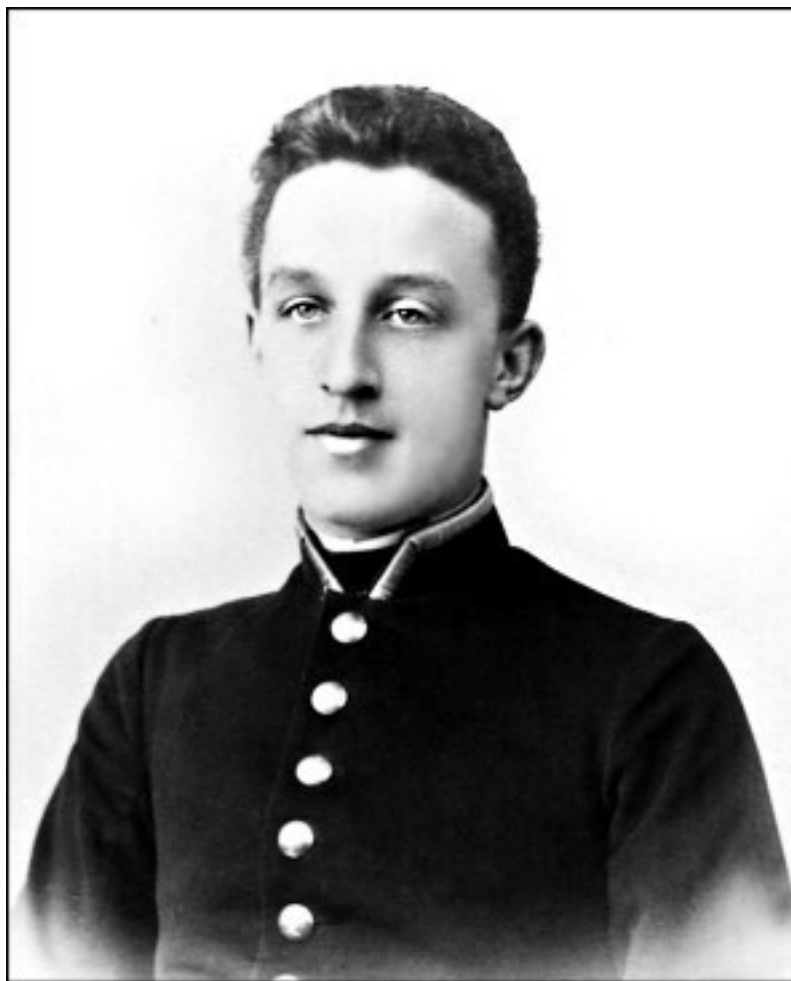
А. Блок в юности