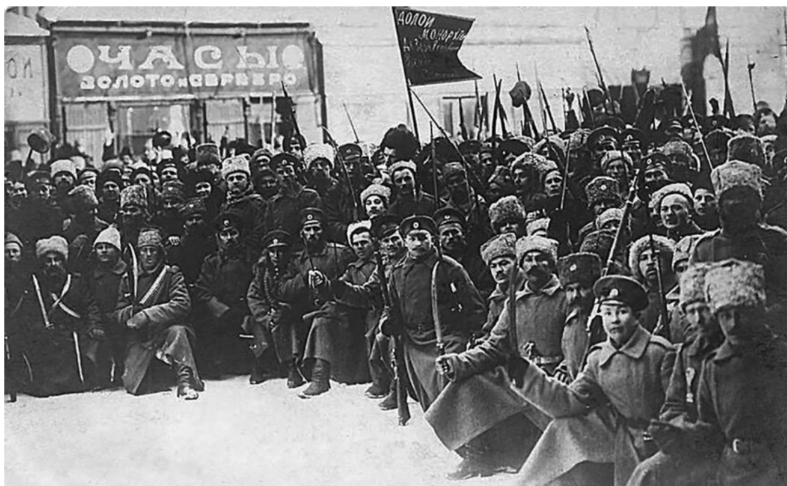
Петроград, Литейный проспект. Февраль 1917 года

Часов в 11 утра (может быть, даже раньше) под окнами нашего дома прошла большая толпа солдат и матросов, направляясь к Невскому. Шли беспорядочно и нестройно, офицеров не было. В эту толпу, по-видимому, стреляли – не то из «Астории», не то из министерства земледелия: точно это никогда не было установлено, да и самый факт стрельбы также не установлен, – возможно, что это было позднее выдуманно.