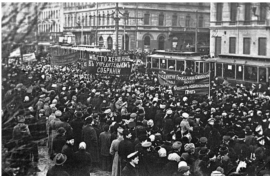
Манифестация в Петрограде в марте 1917 года

Не помню уже, как я оказался в вестибюле. Внутренность Таврического дворца сразу поражала своим необычным видом. Солдаты, солдаты, солдаты, с усталыми, тупыми, редко с добрыми или радостными лицами; всюду следы импровизированного лагеря, сор, солома; воздух густой, стоит какой-то сплошной туман, пахнет солдатскими сапогами, сукном, потом; откуда-то слышатся истерические голоса ораторов, митингующих в Екатерининском зале, – везде давка и суетливая растерянность. Уже ходили по рукам листки со списком членов Временного правительства.