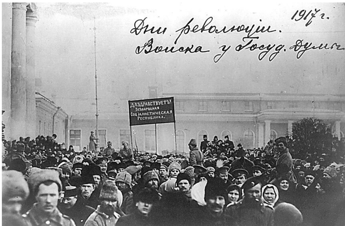
Войска и народ у здания Государственной думы, февраль 1917 года

В эти 40–50 минут, пока мы шли к Государственной думе, я пережил не повторившийся больше подъем душевный. Мне казалось, что в самом деле произошло нечто великое и священное, что народ сбросил цепи, что рухнул деспотизм... Я не отдавал себе тогда отчета в том, что основой происшедшего был военный бунт, вспыхнувший стихийно вследствие условий, созданных тремя годами войны, и что в этой основе лежит семя будущей анархии и гибели... Если такие мысли и являлись, то я гнал их прочь.