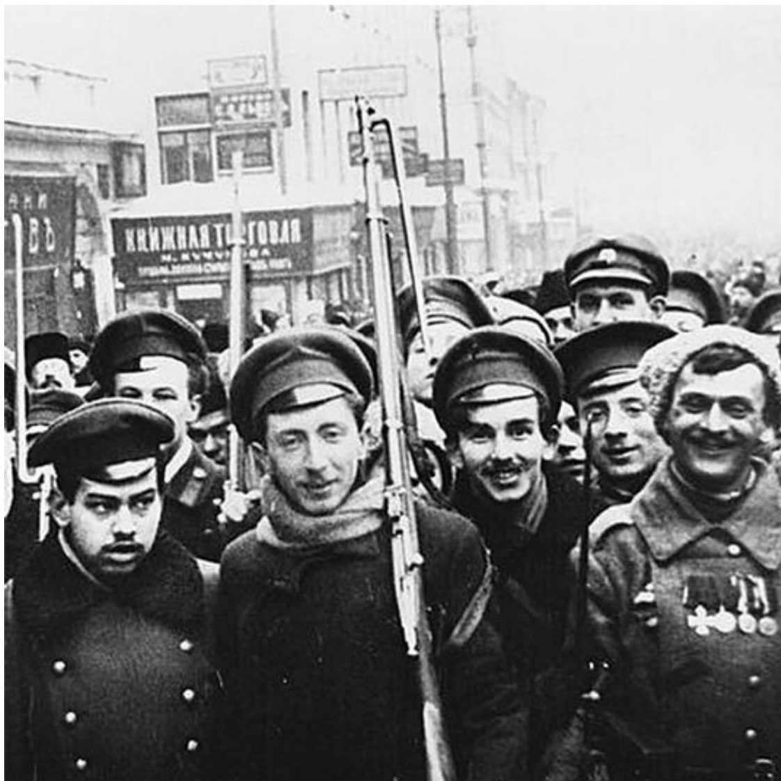
Восставший народ на улице Петрограда, февраль 1917 года

благородство характера, лишённого при том властолюбия и деспотических замашек. Устранен был бы роковой допрос о созыве Учредительного собрания во время войны. Могло бы быть создано не Временное правительство, формально облечённое диктаторской властью и фактически вынужденное завоевывать и укреплять эту власть, а настоящее конституционное правительство на твердых основах закона, в рамки которого вставлено бы было новое содержание. Избегнуто бы было то великое потрясение всенародной психики, которое вызвано было крушением престола. Словом сказать, переворот был бы введен в известные границы – и, может быть, была бы сохранена международная позиция России. Были шансы сохранения армии.