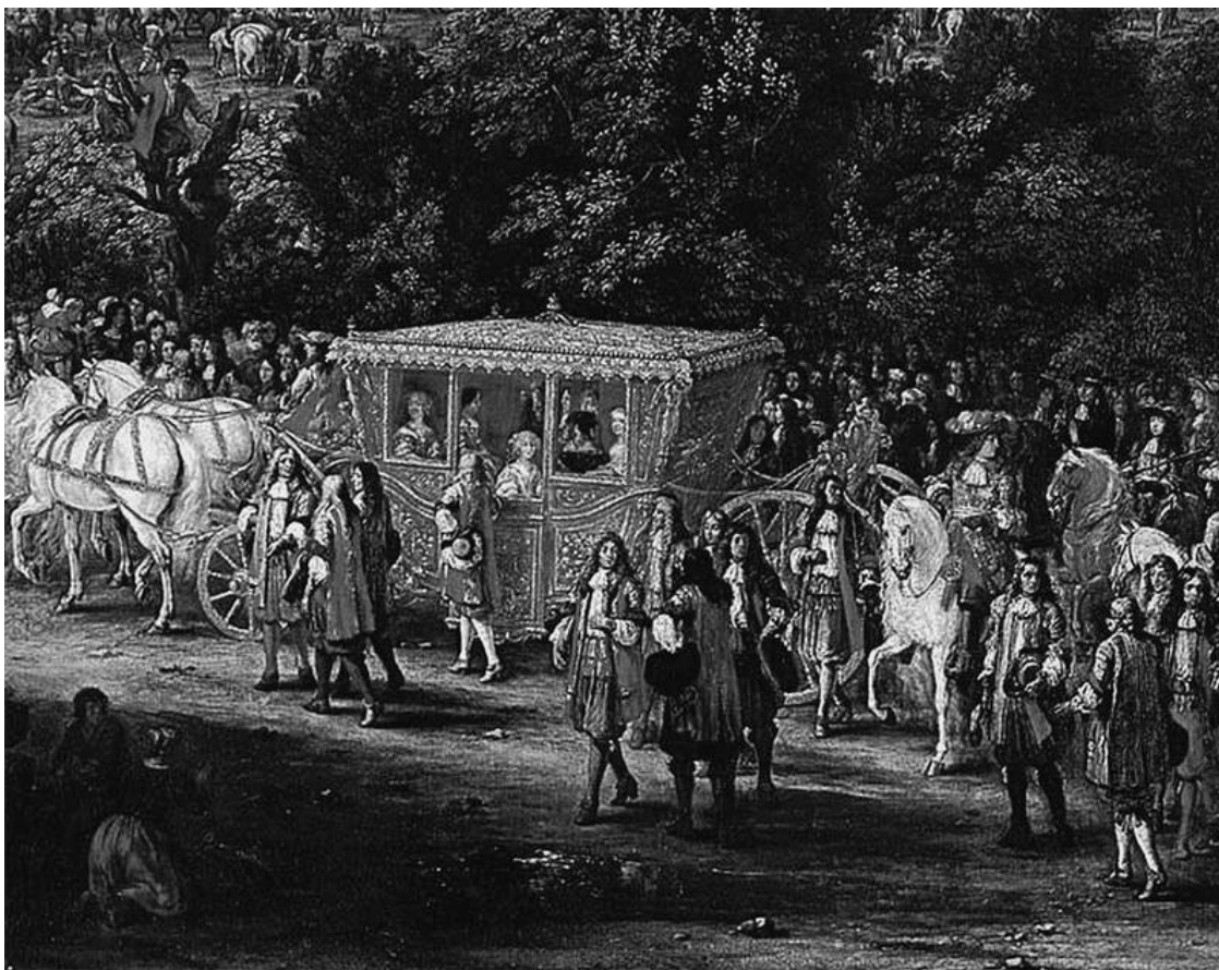
Встреча Людовика XIV и принцессы Марии-Терезии 30 июля 1667 года. Гобелен

метанием копья. После этого король переодевался и завтракал. Перекрестившись, он поднялся к кардиналу Мазарини, «который жил над его покоем, располагался по-домашнему и вызывал сюда государственного секретаря с докладами», беседовал с кардиналом «об этих докладах и о других более секретных делах в течение часа или полутора часов». Король отшлифовывает в это время манеры и делает их поистине совершенными. Двор и монарх действуют необычайно слаженно, и благородное поведение одних способствует развитию благородных чувств у других. Современники считали, что страна, наконец, достигла наивысшего уровня цивилизации.