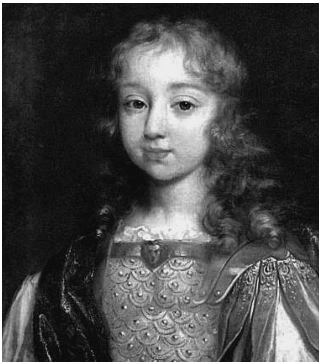
Людовик XIV в восемь лет. Художник Симон Вуэ

Ла Порт ненавидел Мазарини и настраивал против него Людовика XIV. Однажды кардинал проходил по галерее дворца в окружении многочисленной свиты. Маленький король не смог удержаться от громкого возгласа: «А вот и султан!» Об этом инциденте немедленно доложили его преосвященству, а королеве-матери слова короля передал кардинал. Людовик наотрез отказался сообщить, чью фразу он повторил, а то, что повторил, было для всех очевидно. Будучи еще слишком маленьким, король не мог оценить важности Мазарини для Франции. Нужна была Фронда для того, чтобы Людовик понял истинное положение вещей и начал восхищаться своим крестным отцом. Вольтер писал: «Мазарини продлил детство монарха настолько, на сколько смог». Вспомните, в романе А. Дюма-отца «Двадцать лет спустя» мушкетеры не хотят называть первого министра иначе, чем «мужлан». Однако на самом деле этот человек не слишком знатного происхождения в душе был не просто благородным человеком, а истинным аристократом.