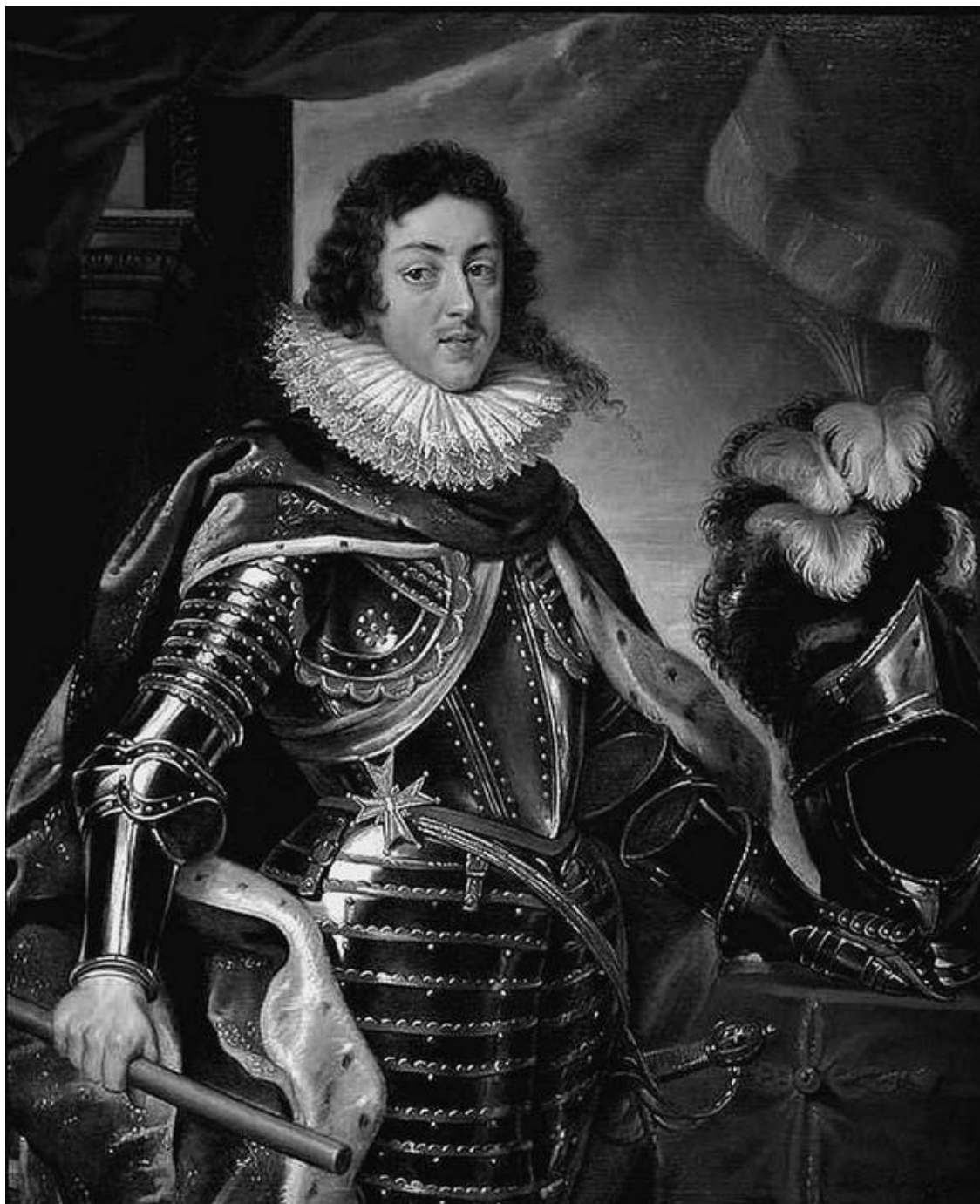
Король Людовик XIII – первый владелец Версаля

Людовик XIV являлся самым почитаемым европейским монархом XVII века, и пышное возвеличивание собственной власти стало важнейшей частью его политической программы. Существенную роль в этом должен был играть новый королевский дворец.