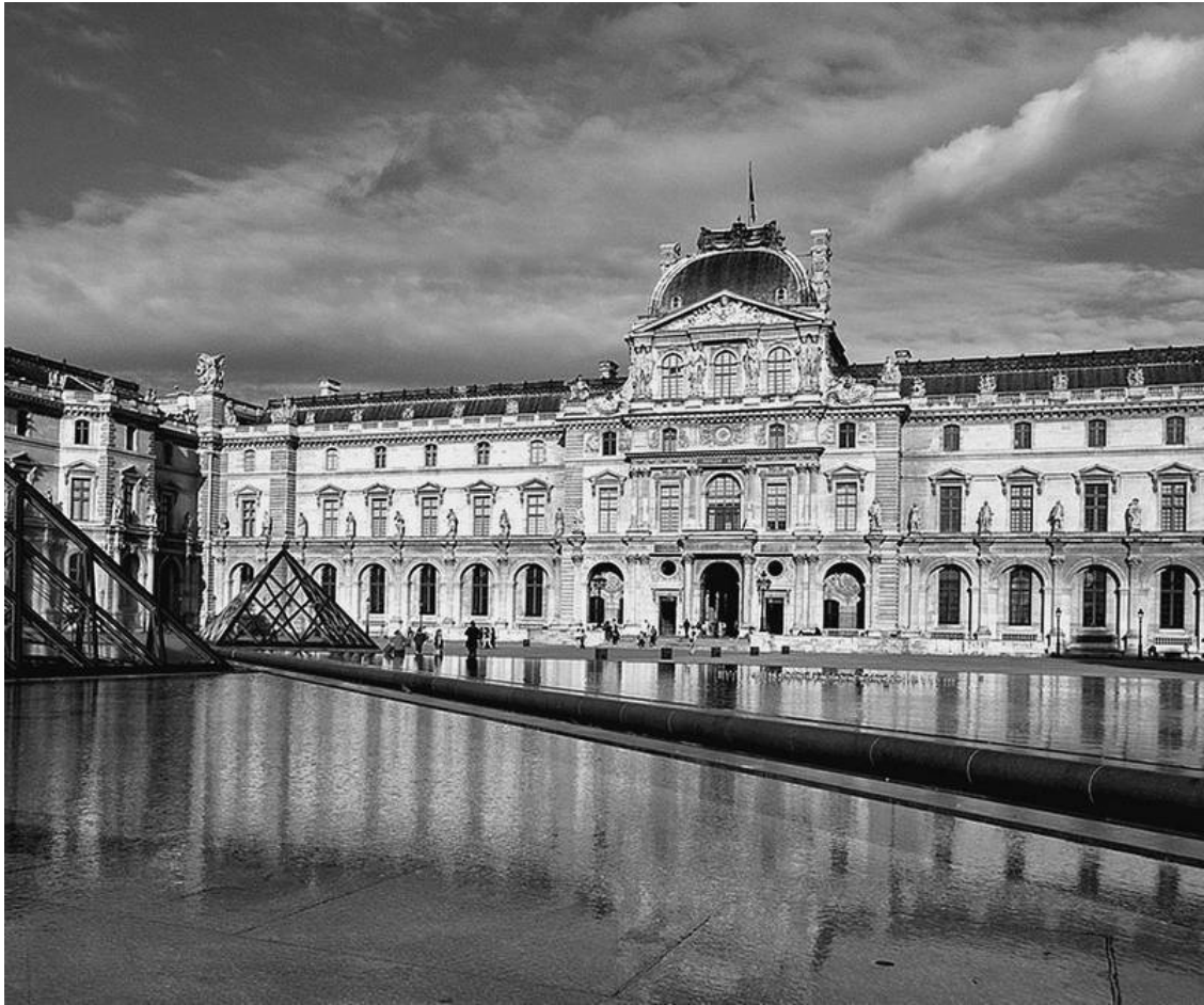
Лувр. Современный снимок