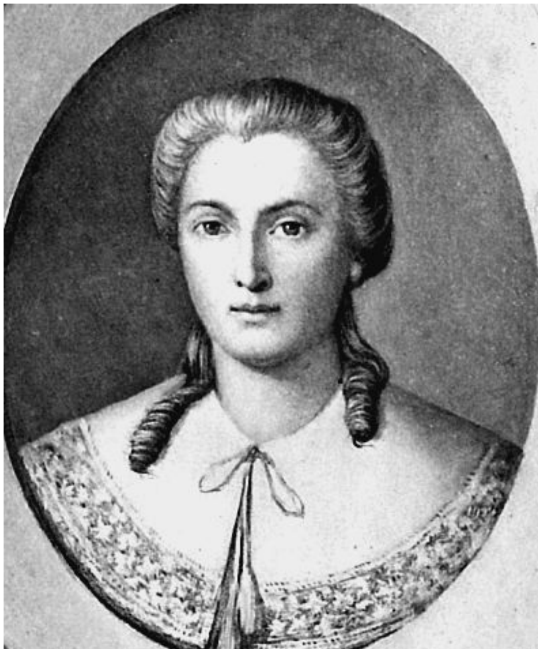
Луиза де Лафайет

Зачатие произошло в Лувре 5 декабря 1637 года. Людовик XIII возвращался из своего охотничьего замка в Версале и остановился у ворот монастыря, чтобы немного поговорить с Луизой де Лафайет 6 . Когда-то она была королевской фавориткой, но стала прилежной послушницей и постоянно молилась о примирении королевской четы. Внезапно разразилась сильная гроза. Капитан королевской гвардии уговорил короля поужинать в Лувре. Людовик XIII остался в ту ночь в покоях королевы, а через девять месяцев, ровно день в день, у Анны Австрийской родился сын.