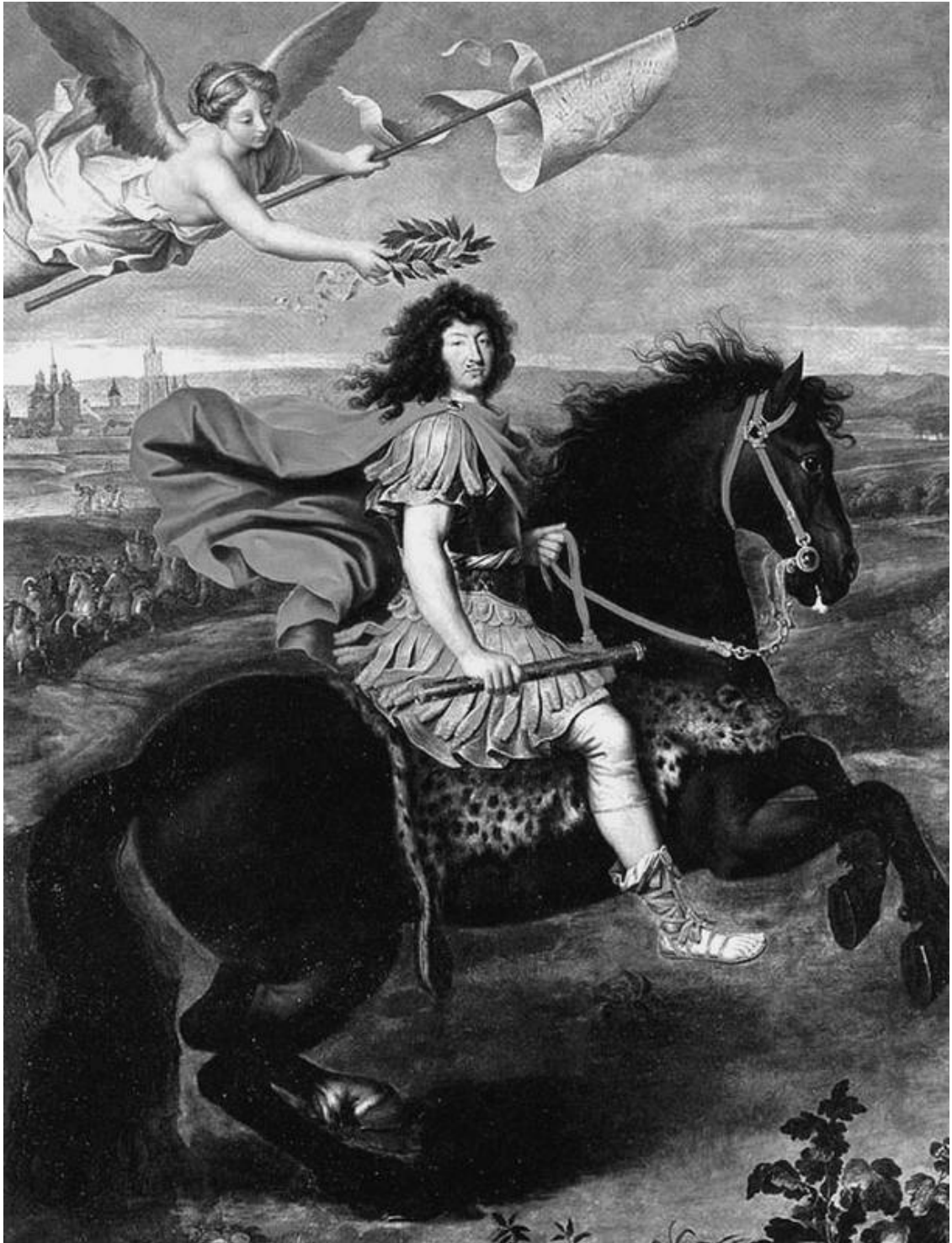
Король Людовик XIV в славе

Царствование Людовика XIV было одним из самых долгих в истории – 54 года. Именно на это время пришелся тот самый период высшего расцвета национальной абсолютной монархии, который в судьбе каждого великого народа получает, как правило, название «Золотой век». Это время представляло собой классический образец могущества неколебимой власти монарха.