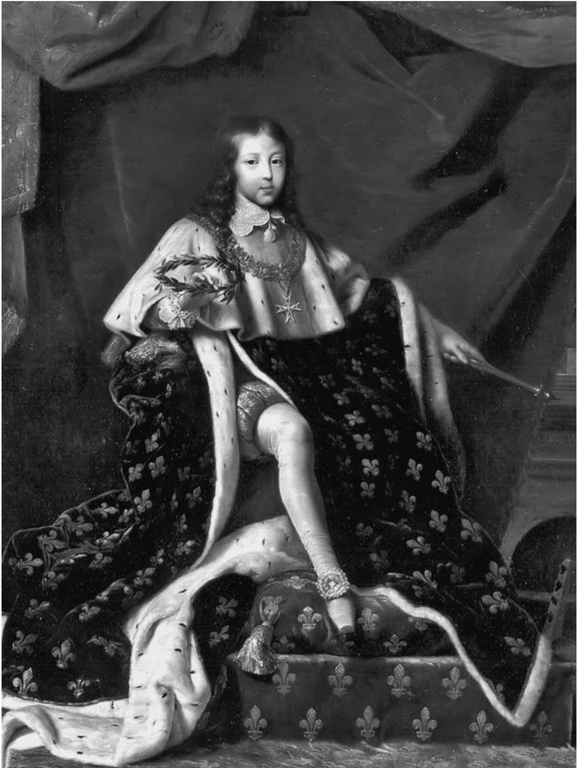
Людювик XIV в день коронации. Художник Генрих Тестелин

От короля не требуют быть ангелом, хотят лишь, чтобы он подражал Иисусу Христу. Проповедники сравнивают короля с царем Давидом. Священное Писание, в свою очередь, рассматривает Христа не только как Бога, пастыря и пророка, но и как царя. То есть в таинстве миропомазания власть небесная и власть земная сливаются воедино, и король соединяет их неразрешимо. «Королевская власть не безлика и восходит к заранее созданному образцу. В королевской власти всегда есть та частица, которая умирает и воскресает, – сын, который при-