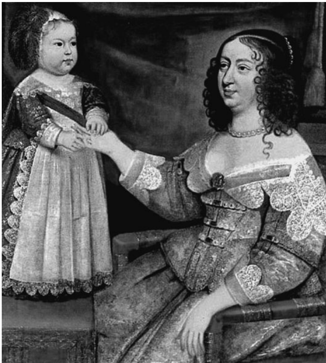
Анна Австрийская с Людовиком XIV

Детство короля – это не безоблачное детство простого ребенка: оно всегда организовано и продумано до мелочей. В пять лет король не просто венценосец, он не кукла и не театральный актер. Он никогда не играет, но всегда является олицетворением монарха. Даже невнятно сказанные детские слова обретают силу закона.