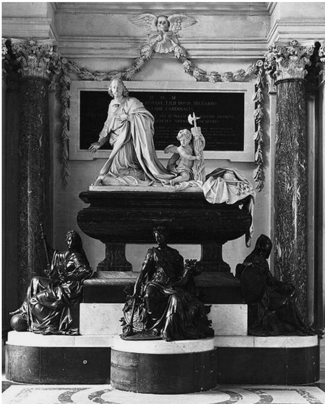
Надгробие кардинала Мазарини

Аббат де Шуази 30 замечает о короле: «В возрасте двадцати двух лет он приступил к управлению государством, и это не показалось ему обременительным. Его ум, который скрывался до этого под скромным обликом детского простодушия, проявился полностью: он изменил