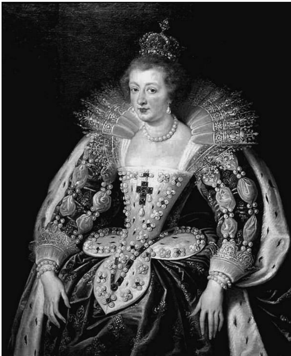
Анна Австрийская, королева Франции. Художник Питер Пауль Рубенс

Это обстоятельство доставило немало неприятностей мадам де Ментенон 22 , которая не переносила холода и мучалась от ревматизма.