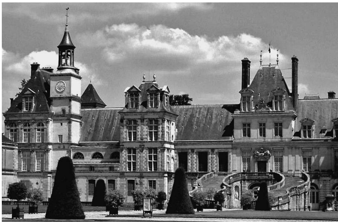
Дворец в Фонтенбло

17 августа 1661 года. Этот день был чрезвычайно душным и жарким. Даже земля рас- трескалась, а застывший раскаленный воздух обжигал все живое. Над дорогой, ведущей из Фонтенбло 31 , поднималось густое черное облако пыли. Королевский кортеж пустился в путь в самое тяжелое время дня – в три часа пополудни. Окна карет, украшенных позолоченными дворянскими гербами, были наглухо закрыты. Придворные задыхались в своих наглухо застег- нутых камзолах, накрахмаленных кружевах и тяжелых париках. Дамы не могли найти спасения от едкого запаха лошадиного пота и пыли, проникающей во все щели. Карета короля летела, словно на крыльях, уносимая шестеркой белоснежных лошадей. Рядом с королем находились его мать, Анна Австрийская, и брат, герцог Филипп I Орлеанский (1640–1701). Охраняли про- цессию вооруженные мушкетеры и гвардейцы.