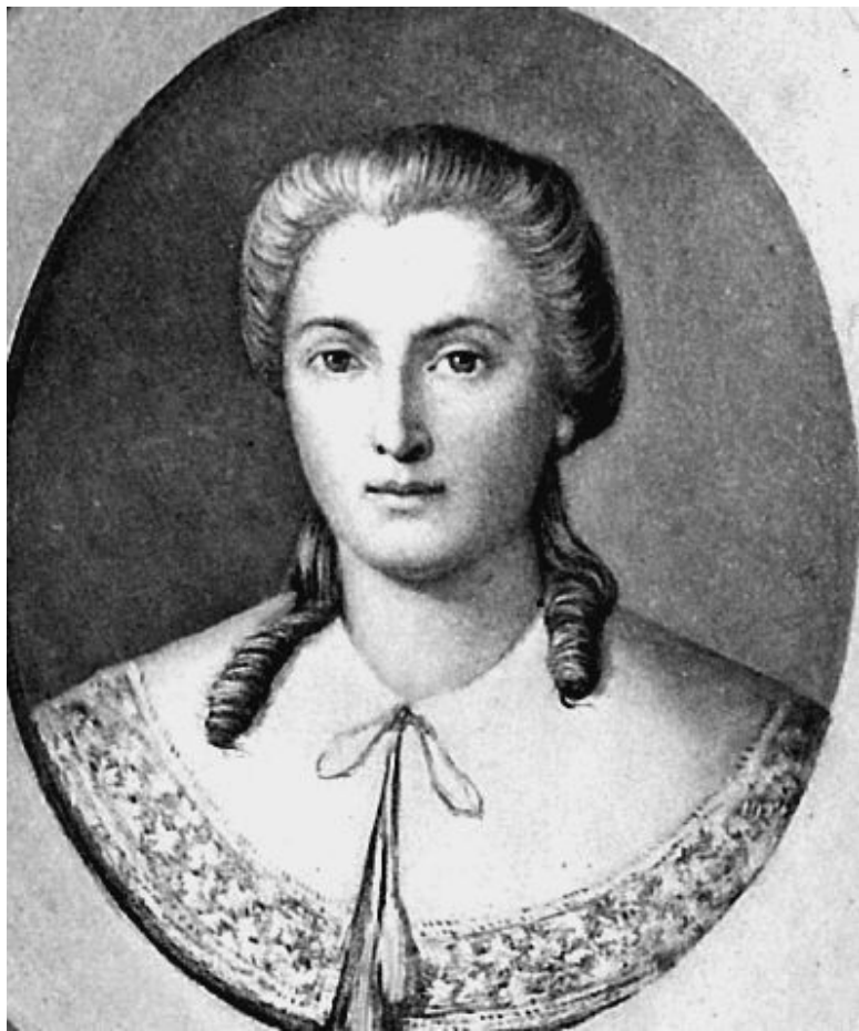
Луиза де Лафайет