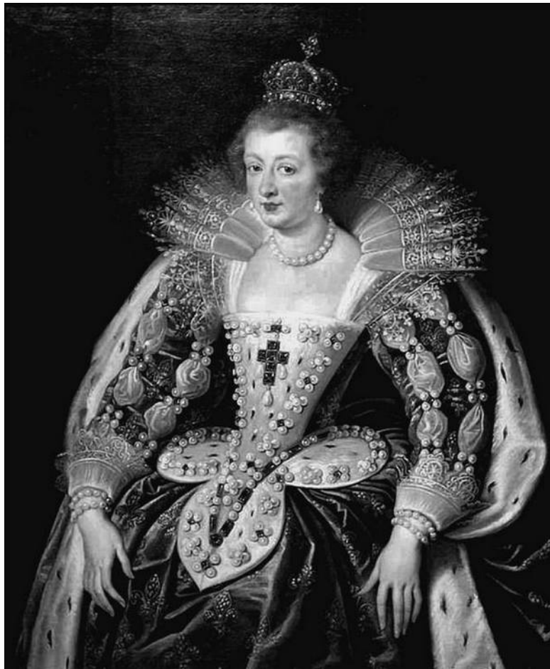
Анна Австрийская, королева Франции.