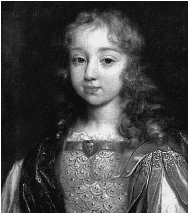
Людовик XIV в восемь лет. Художник Симон Вуэ