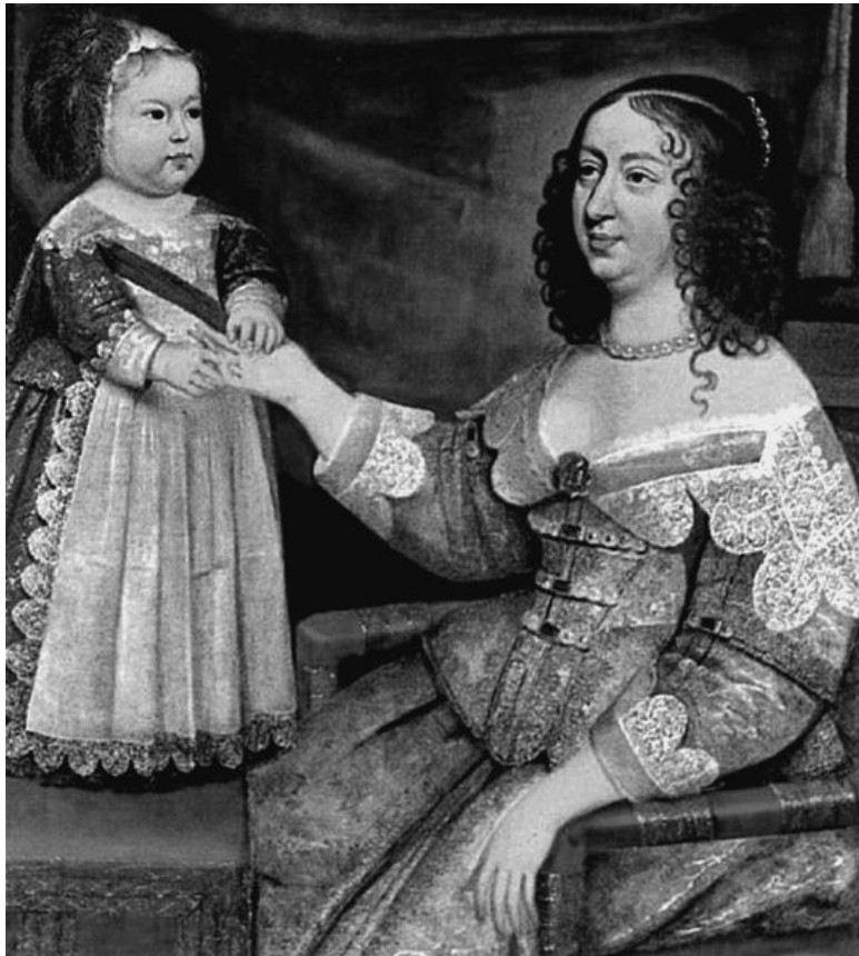
Анна Австрийская с Людовиком XIV

Детство короля – это не безоблачное детство простого ре-