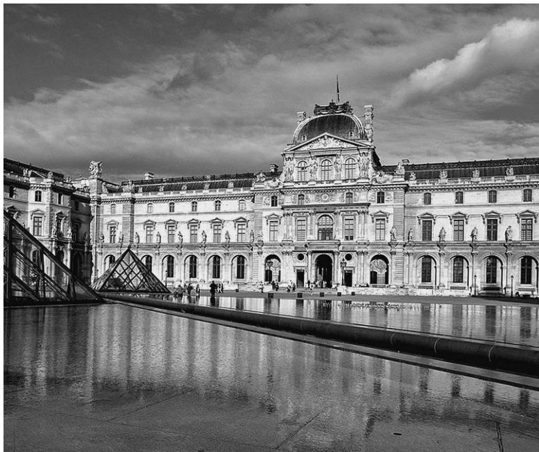
Лувр. Современный снимок

Путешествия монархов по королевству в зените славы не способствуют развитию кругозора. Познавательная цель здесь начисто отсутствует. Его величество может лишь любоваться тем искусственным миром, который ему добросовестно представляют: чистенькие образчики ремесел и пред-