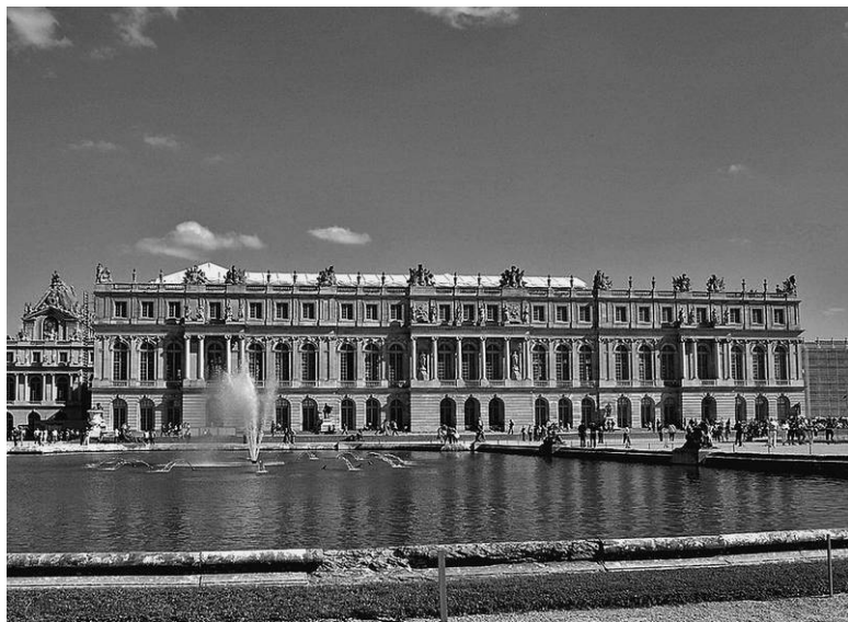
Вид на Версаль со стороны Водного партера

году. Восседающий на коне Людовик величественно и строго смотрит на переменчивый мир, на созданный по его указу символ мощной государственной власти – Версаль.