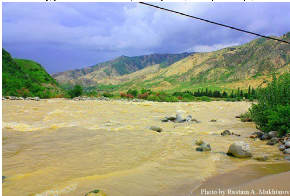
Река Кофарнихон весной.

Переходя через горную реку по качающемуся, вздрагивающему от каждого шага людей мосту, невольно залюбовались дикой красотой бурной горной реки. Немного постояли над стремительно несущимся водным потоком, держась за ненадёжные перила, рассматривая белые пенистые буруны на ближайшем пороге и слушая грозный рокот Кафернигана.