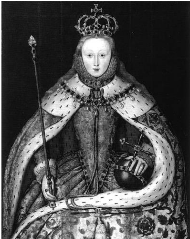
Коронационный портрет Елизаветы I