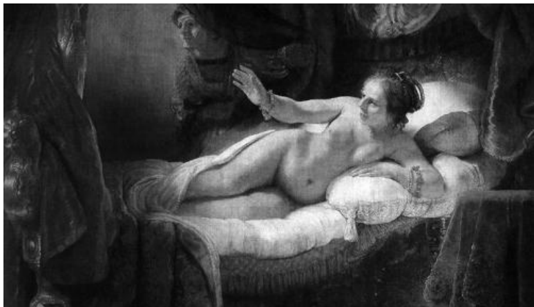
Рембрандт ван Рейн. «Даная», (1636), фрагмент