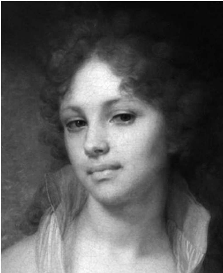
Боровиковский В. Л. Портрет М. И. Лопухиной (1797), фрагмент