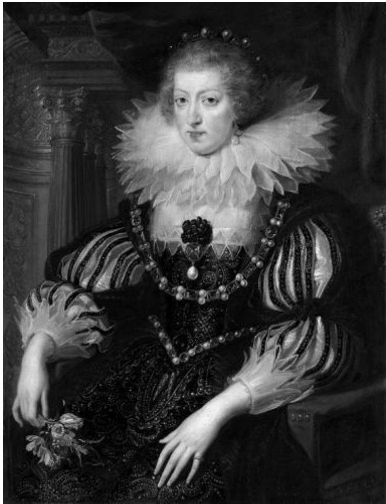
Рубенс. «Королева Франции Анна Австрийская» (1625)