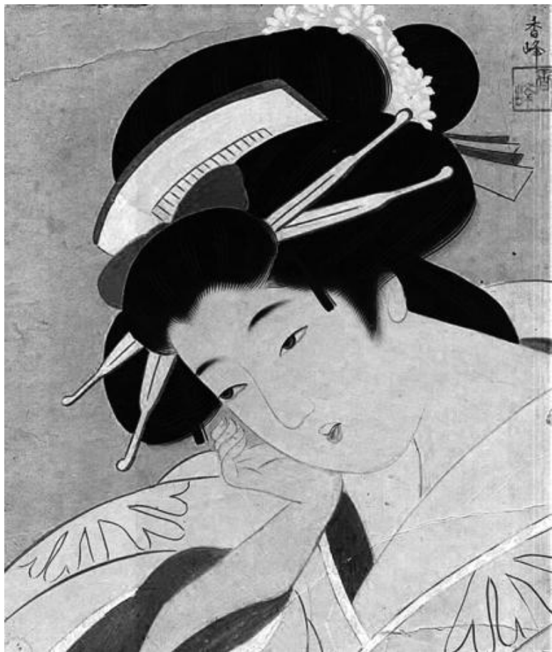
Китагава Утамаро. «Большая гейша» (1905)