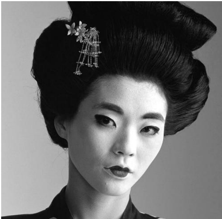
Повседневный макияж гейши