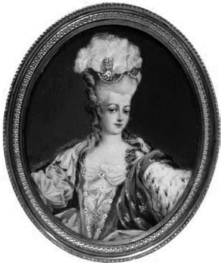
Виже-Лебрен. «Мария-Антуанетта, королева Франции» (1778)