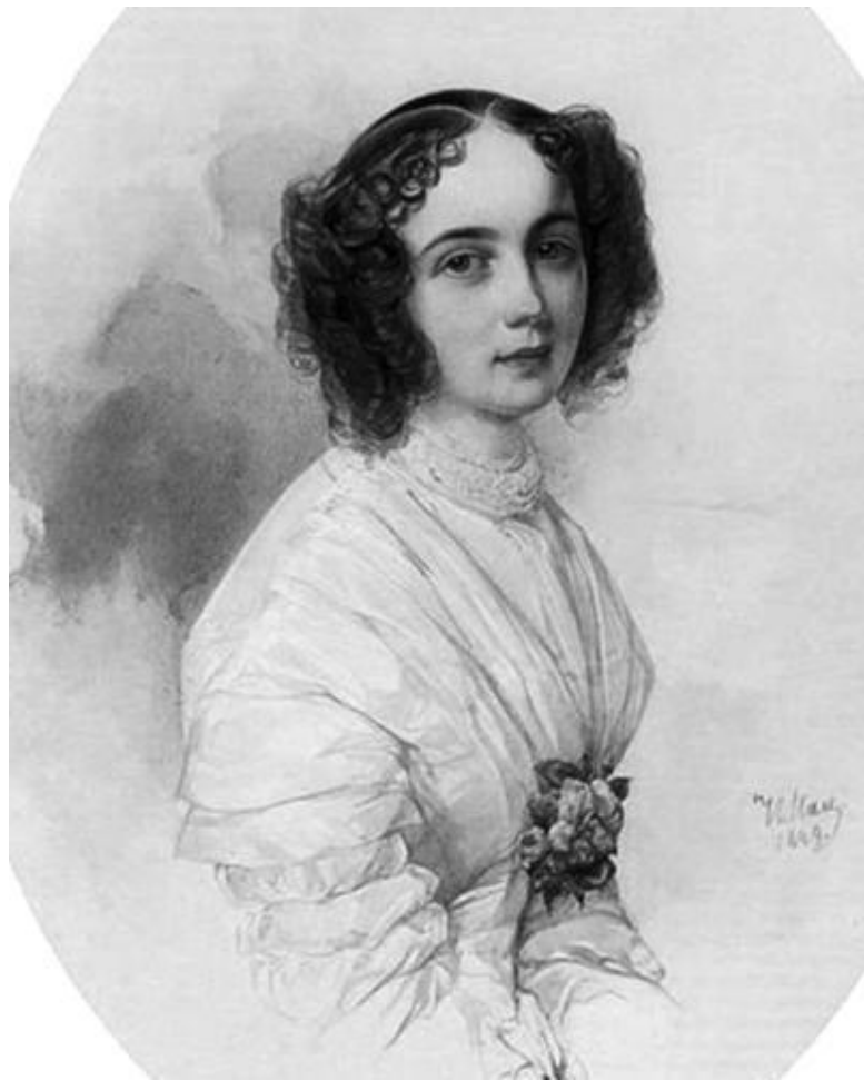
Гау В. И. «Елизавета Полетика» (1849), фрагмент