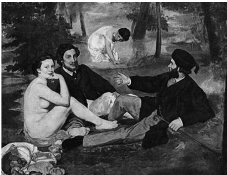
Эдуард Мане. «Завтрак на траве» (1863), фрагмент

огонь и способствуют развитию целлюлита.