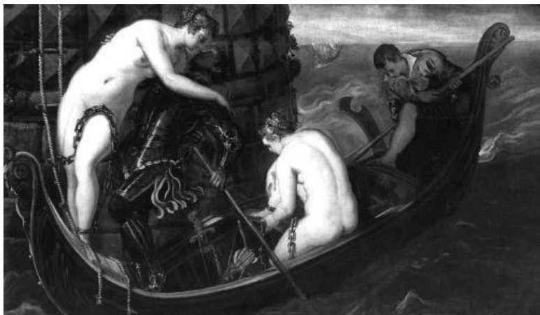
Якопо Тинторетто. «Спасение Арсинои» (1556)

Сочетать гимнастику лучше с профессиональным массажем проблемных зон. Он улучшит циркуляцию крови, а также активизирует отток лимфы из пораженных участков. Если вам не по карману профессиональный массажист, воспользуйтесь массажерами – шишечками, пластинами, шариками.