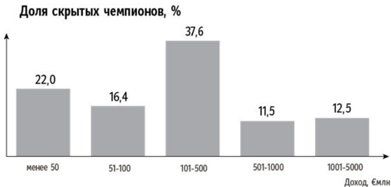
Рис. 7.2. Распределение доходов скрытых чемпионов Германии

скрытый чемпион зарабатывает €1 млн в год, а самый крупный – €4966 млрд. Рисунок 7.2 показывает распределение дохода скрытых чемпионов Германии.