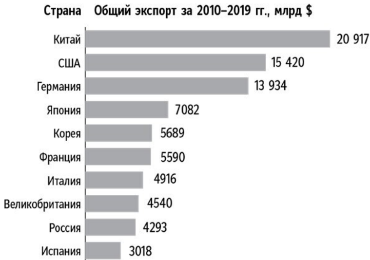
Рис. 2.1. Общий экспорт крупнейших стран-экспортеров, 2010–2019 гг.

Китай обошел Германию в качестве мирового лидера по экспорту в 2009 году и с тех пор занимает первое место. США тоже обогнали Германию по общим продажам. Однако экономика этих двух стран во много раз крупнее экономики Германии. Выдающиеся результаты по экспорту немецких компаний четко видны, если сравнивать данные на душу населения (рис. 2.2).