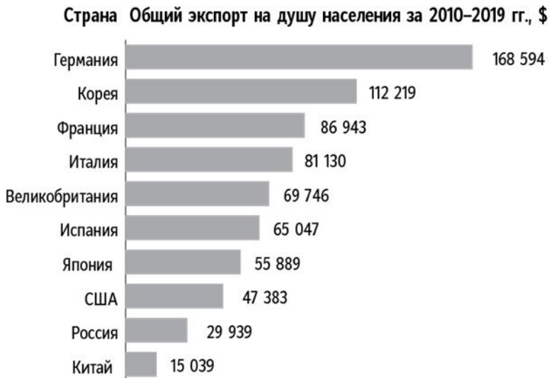
Рис. 2.2. Экспорт на душу населения крупнейших стран-экспортеров, 2010–2019 гг.

По экспорту на душу населения Германия – бесспорный лидер среди крупных стран, особенно если сравнивать с европейскими соседями. Можно было бы ожидать, что Франция, Италия, Великобритания и Испания покажут более высокий результат по экспорту на душу населения, чем Германия, поскольку в странах с небольшим населением, как правило, этот показатель более высокий, чем в крупных странах. Однако в случае с Германией верно обратное. Экспорт на душу населения в Германии минимум в 2 раза больше,