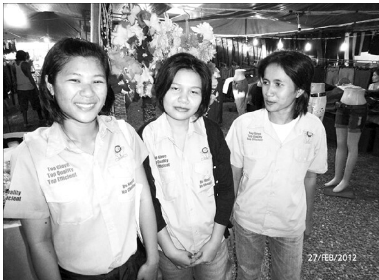
Рис. 6.1. Интернационализация скрытого чемпиона из развивающейся страны: сотрудники малазийского мирового лидера Top Glove на промышленной ярмарке в Китае

го рынка 25 %, несколько других производителей ведут активный бизнес по всему миру и основали глобальные бренды. На рис. 6.1 вы видите трех сотрудников Top Glove на промышленной ярмарке в Китае.