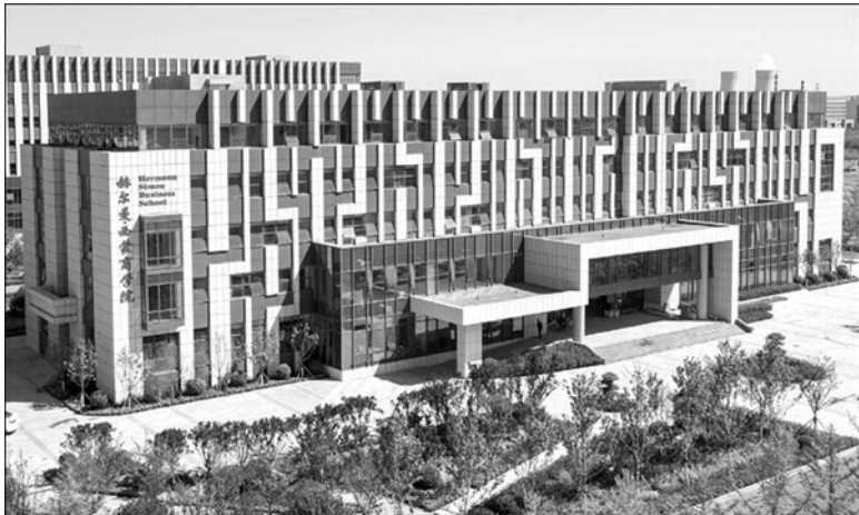
Рис. 5.2. Школа бизнеса имени Германа Симона в Шоугуане, Китай